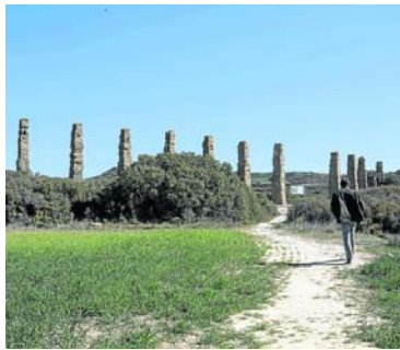
Arriba, yacimiento arqueológico romano de Los Bañales. A la izquierda, vista general del municipio de Tauste, parada de una de las rutas.

palmas, unas formaciones geológicas únicas en España que sorprenden cada año a cientos de visitantes con sus estalactitas de tierra, conocidas popularmente como «chimeneas de lardas»; la imponente sierra de Santo Domingo, declarada Paisaje