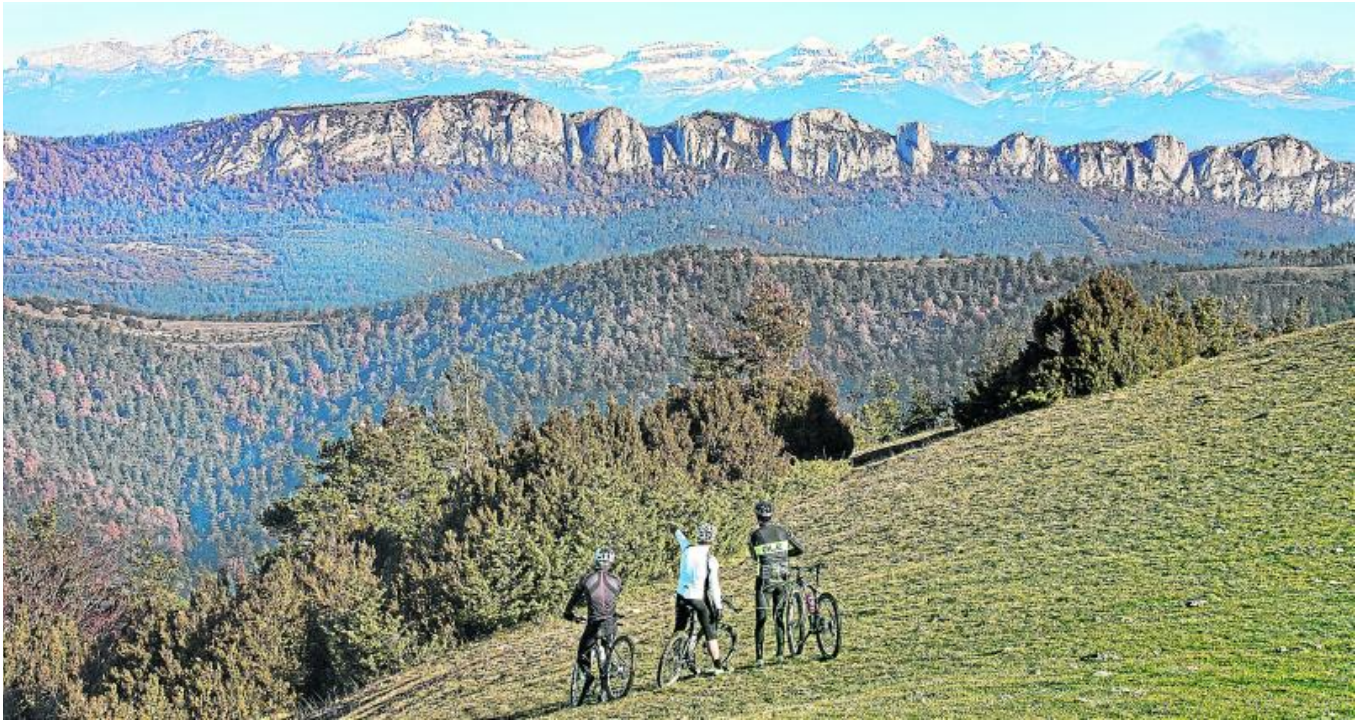
Las Cinco Villas cuentan con una notable riqueza natural y unas características geográficas y geológicas singulares. En la foto, la sierra de Santo Domingo. COMARCA CINCO VILLAS