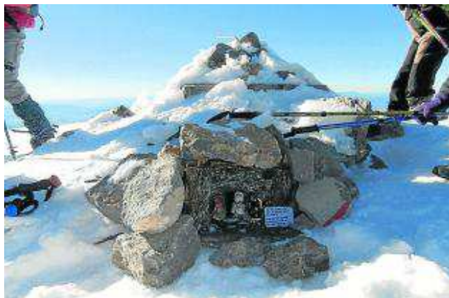
El belén realizado por la Asociación Belenista de Graus.