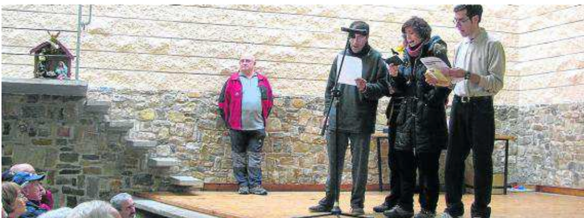
Villancicos de Montañeros de Santa María.