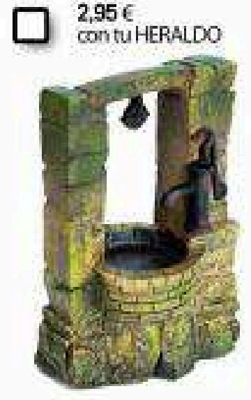
2,95 € con tu HERALDO 1495 - Pozo de Belleza de Flumen (Huesca)