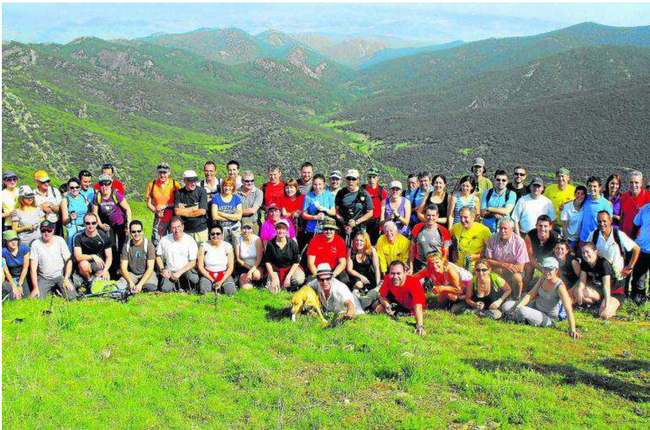
Miembros de la asociación La Butrera de Alpartir. LA BUTRERA

La sierra de Algairén, a 63 kilómetros de Zaragoza, si tomamos como punto de referencia la localidad de Alpartir, es una bella y asequible cadena montañosa, muy poco conocida por los aragoneses e, incluso, a pesar de su cercanía, por los zaragozanos.