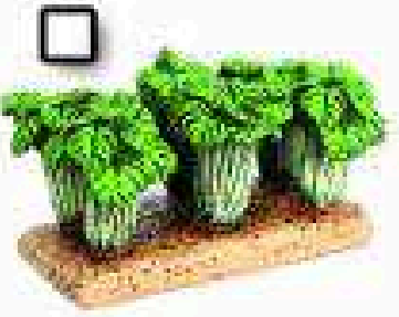
1,95 € con tu HERALDO 1496 - Huerto de borraja