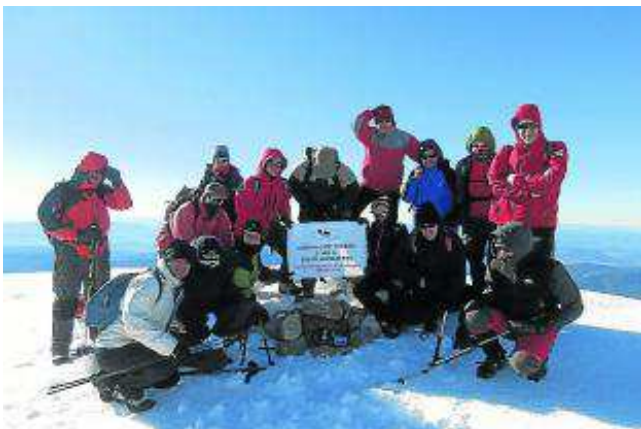
En la cima del Turbón.