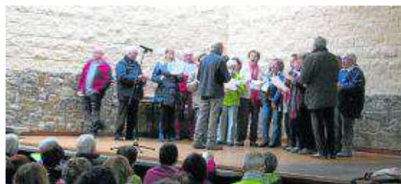
Grupo montañero de Stadium Casablanca.