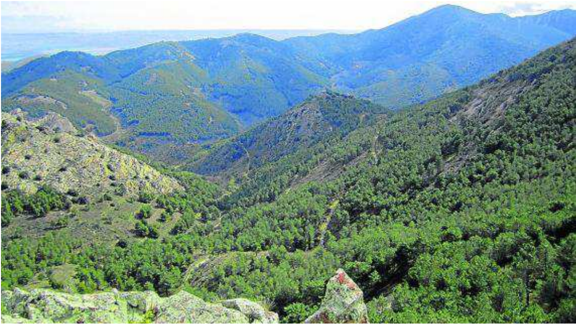
Vistas de la sierra de Algairén desde el pico de La Butrera. LA BUTRERA

Barrancos y caminos de singular belleza, sendas estrechas, unas veces, y senderos sinuosos, otras, hacen la delicia del senderista, que encuentra un espacio para deleitarse junto al valle, por las cumbres, paseando entre ruinas o perdido en arboledas.