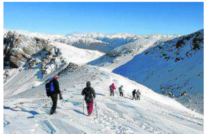
Descenso ante un espectacular paisaje.

Desde hace cinco años, en las fechas previas a la Navidad, el Centro Excursionista de la Ribagorza sube un pequeño belén montañero a la cima del Turbón, la robusta y mítica montaña que emerge en el corazón geográfico de nuestra comarca y constituye el emblema y anagrama de nuestro club. Se trata de un ligero pesebre artesanal confeccionado por la Asociación Belenista de Graus, entidad que realiza en la localidad el montaje de un gran nacimiento navideño incluido en la Ruta del Belén de la provincia oscense.