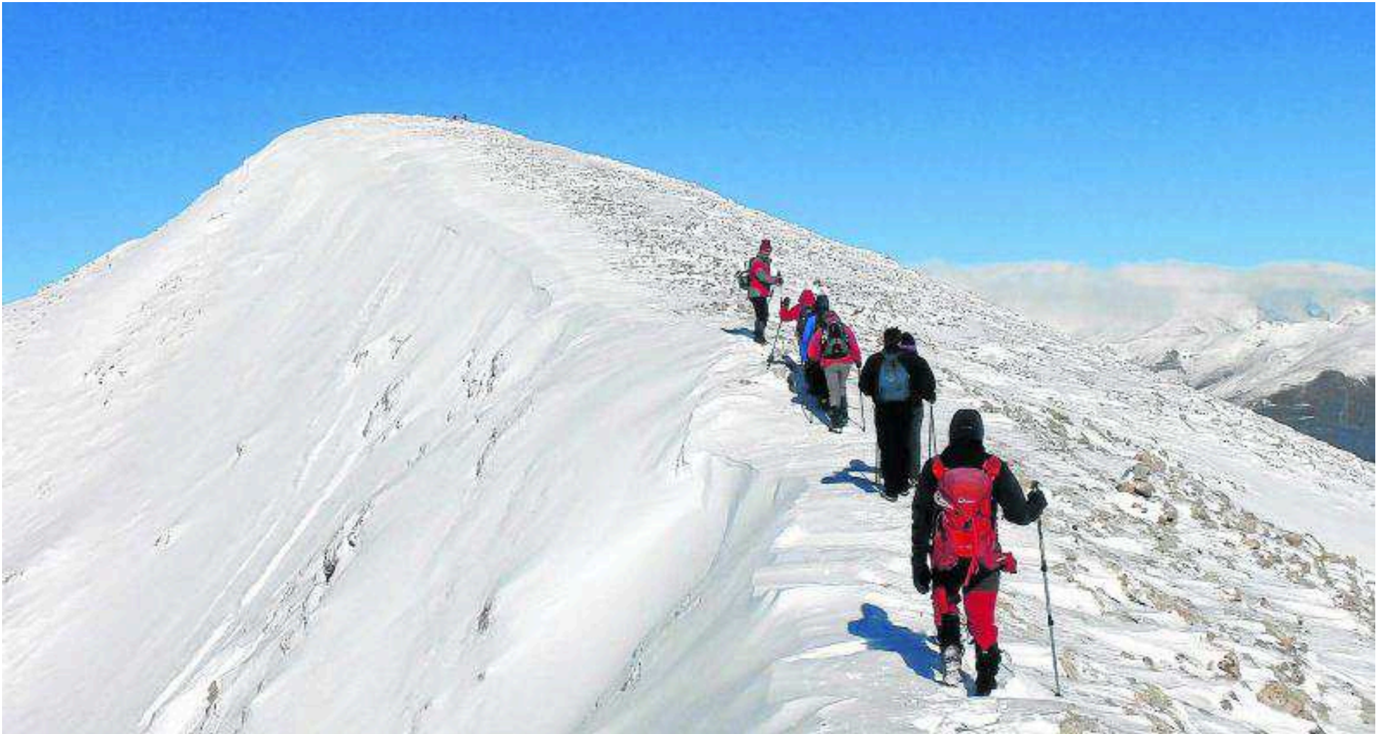
El grupo del CER aproximándose a la cima Turbón.