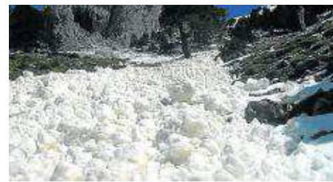
Alud en Peña Montañesa. R.Y.