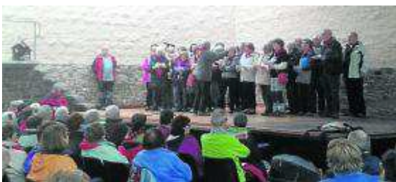
Actuación de los Amigos del Camino de Santiago.