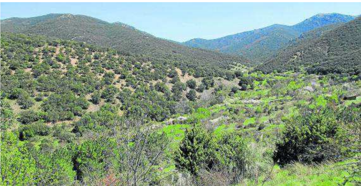
Imagen del robledal de Mosomero, a la izquierda de la imagen. MODESTO PASCAU