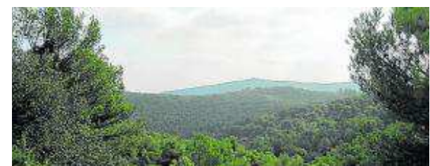
Pinares de Zuera.

Fecha: 21 de diciembre. Fecha: pinares de Zuera.