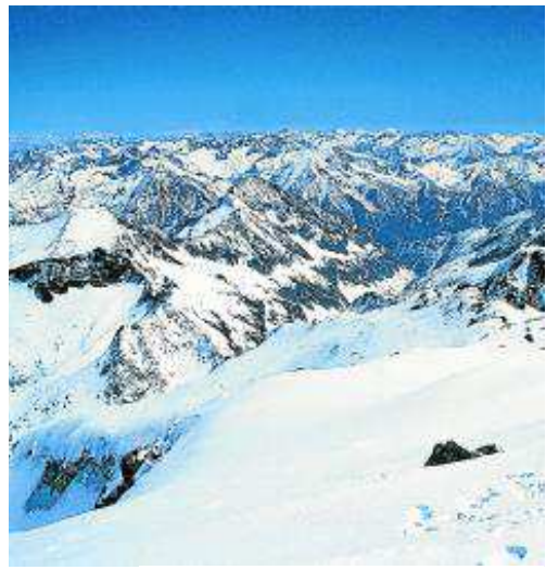
Vistas desde el Aneto.