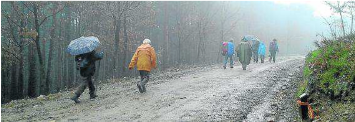
La lluvia no impidió que algunos montañeros acabasen el recorrido.