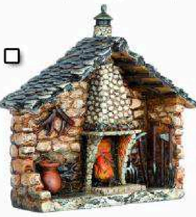
1496 - Borda del Pirineo 14,95 € con tu HERALDO