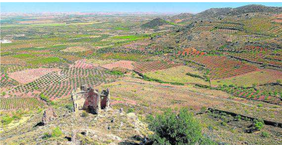
Paisaje que se ve desde San Cristóbal.

a tierras del Campo de Cariñena. Cercano a esta máxima altitud de la sierra está trazado el PR-Z 43, que sube al Alto de la Nevera y que se une al PR-Z 42, en el piedemonte de la sierra. Pero, además, en tierras de Alpartir hay hasta otros 25 senderos balizados que, junto a algunas mesas de interpretación y pies temáticos, ayudan a conocer el entorno. El enlace alpartir.com/mapa-de-sendas-actualizado-2013/ permite acceder a todo este paraíso senderista. Barrancos y caminos de singu-