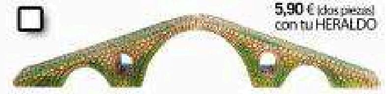
5,90 € (dos piezas) con tu HERALDO 1496 - Puente de Laco de Ibañeta (Teruel)