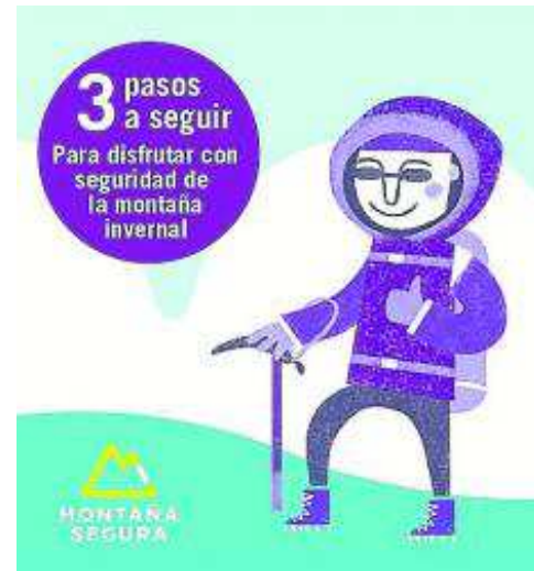
Folleto Montaña Segura Invernal.

Montañeros ascendiendo al Moncayo, montaña en la que se suele bajar la guardia en invierno. LUIS CARLOS MARCO