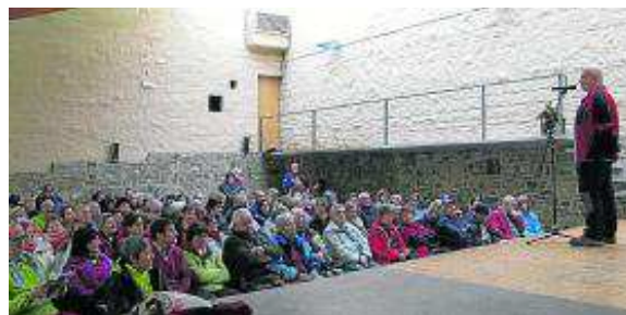
Asistentes al Belén Montañero, durante su presentación.