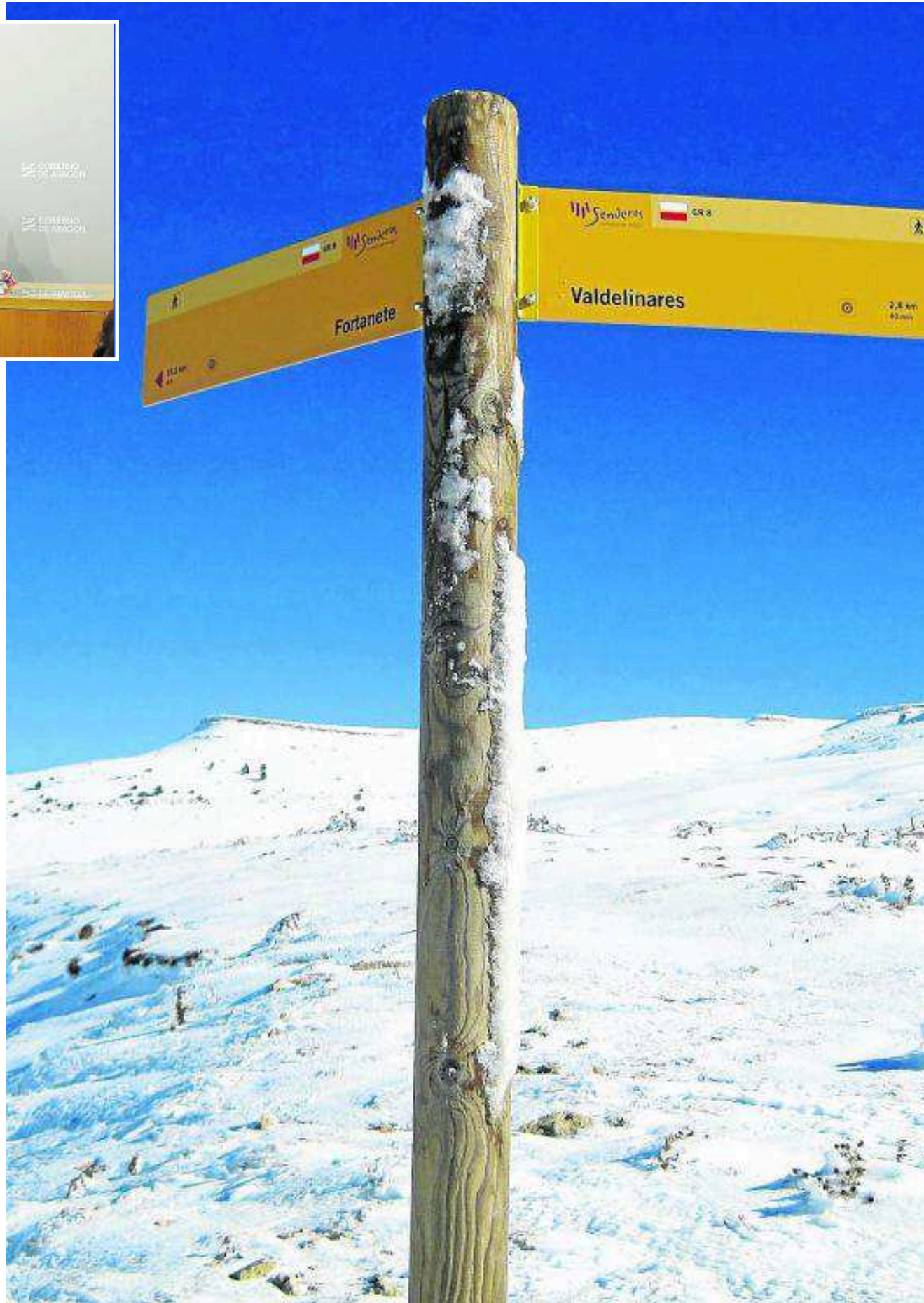
La nueva señalización de los Senderos Turísticos. PRAMES

Además de la importante inversión a realizar, con la hoja de ruta que marca el plan director de senderos, todo este programa de actuaciones también incluye la presencia en hasta 15 ferias internacionales de naturaleza, con el re-