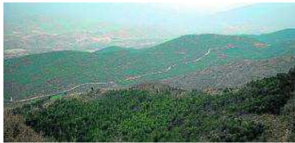
Vistas desde el castillo hacia Petilla de Aragón.

El sendero sigue por pista, dejando a la izquierda las ruinas de unos corrales y, a la derecha, el ci-