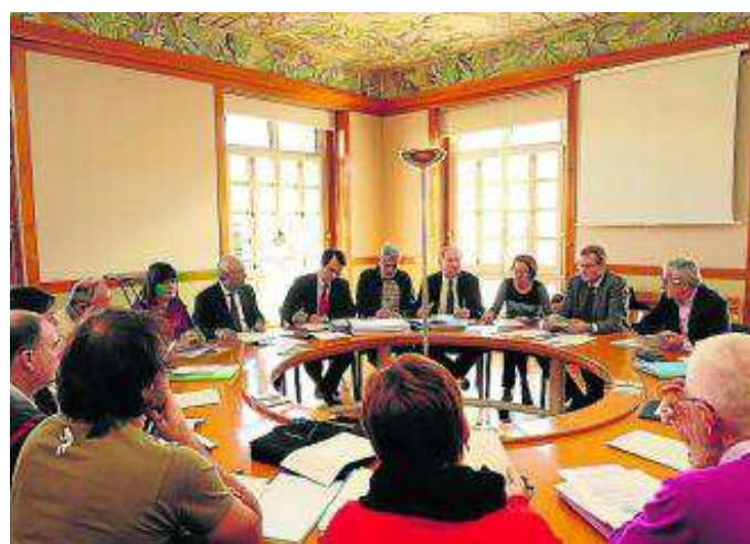
La Comisión reunida el martes pasado. S. E.