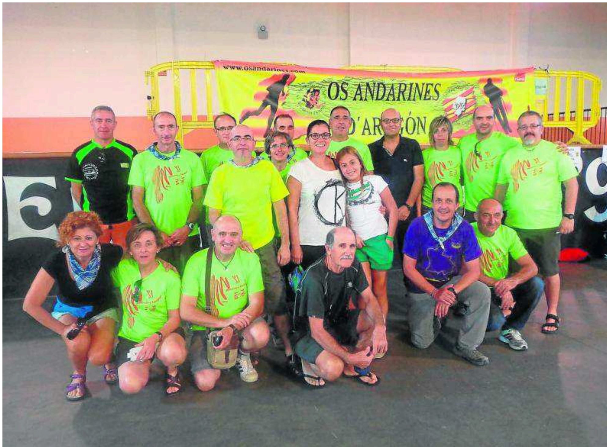
Primeros clasificados en las andadas de Gran Fondo. OS ANDARINES

Hace unos años, en estas mismas páginas, escribía sobre las andadas o carreras de 'largo recorrido'. Hacía referencia a las andadas de larga distancia y a las carreras llamadas 'ultra trail', que eran aptas para algunos senderistas que podían realizar el recorrido en el tiempo exigido por la organización.