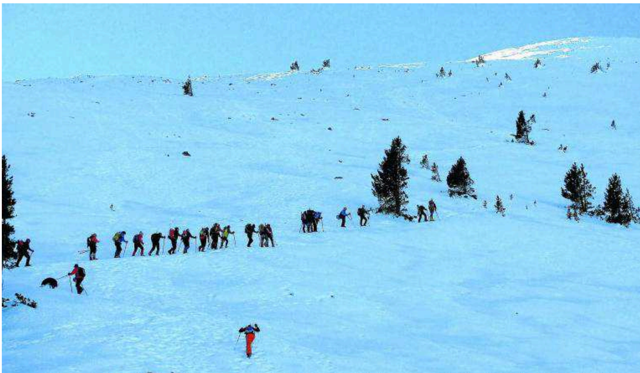
Un grupo del CEM asciendo al Moncayo para poner el belén.