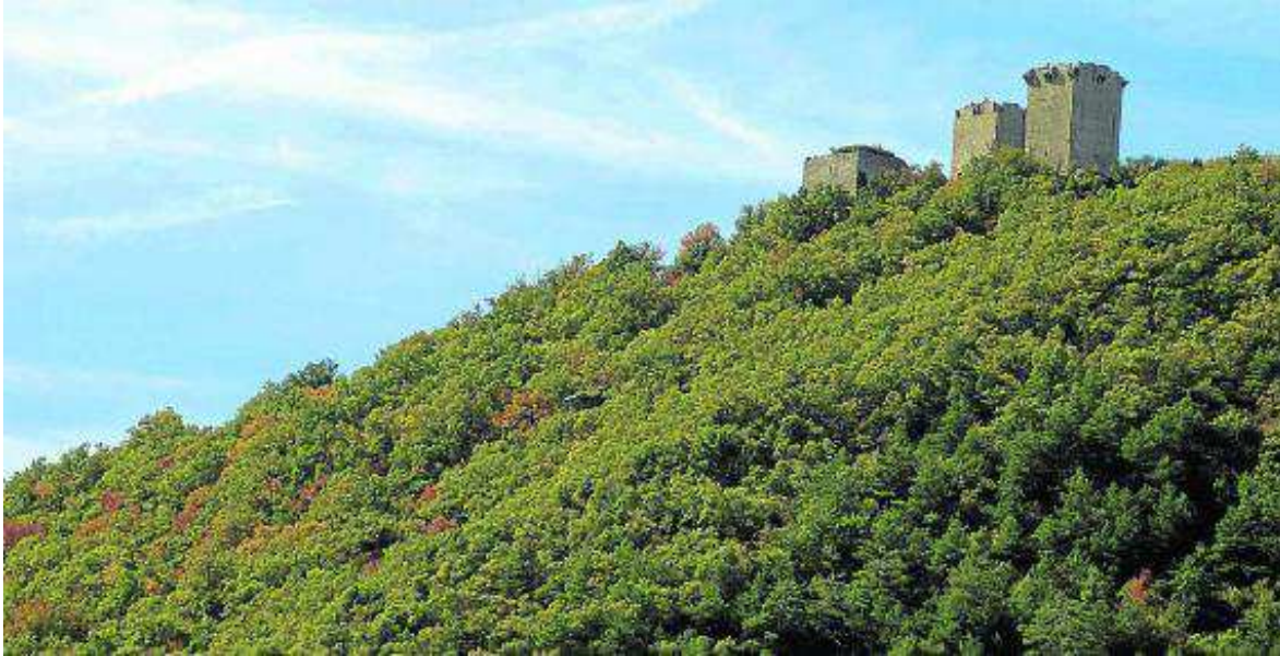
Vista del castillo de Roita y del bosque del barranco de Piqueras.

Desde la monumental villa de Sos del Rey Católico hasta el histórico castillo de Roita, la ruta atraviesa bosques de pinos, quejigos y bojales a lo largo de un tramo del GR 1 que discurre por viejos caminos y pistas forestales.