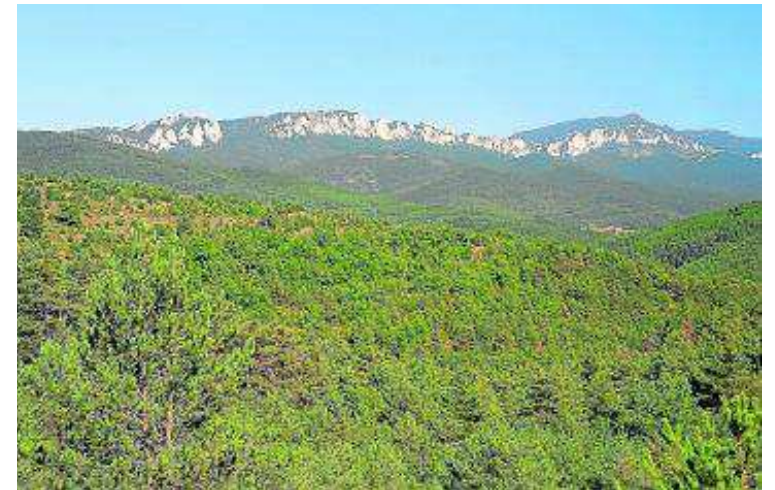
Sierra de Santo Domingo, desde la sierra de Luesia.

Fecha: 21 de diciembre. Lugar: pinares de Zuera.