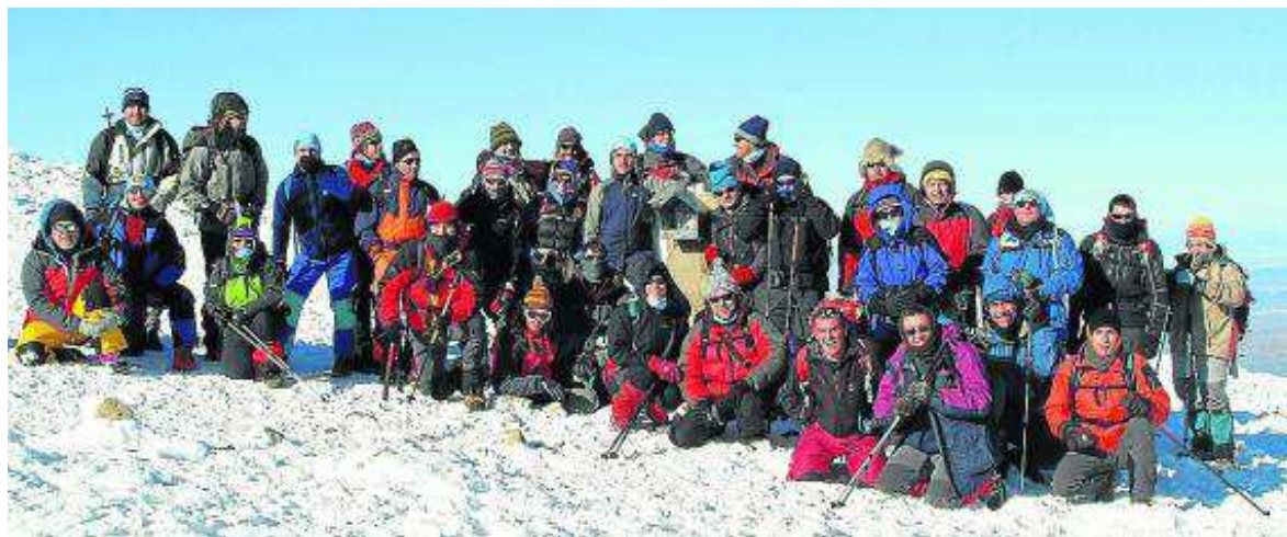
El grupo del Belén Montañero del CEM en 2009.