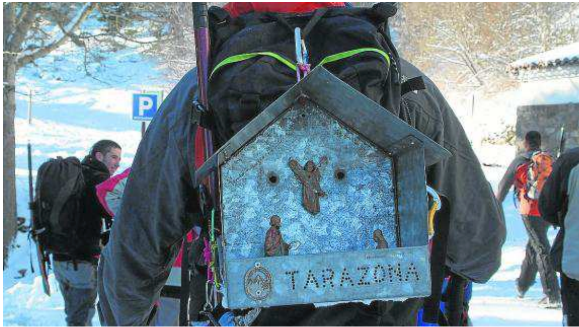
Preparados para portear el belén.

Este año, la organización del Belén Montañero de la Federación Aragonesa de Montañismo ha recaído en el Centro Excursionista Moncayo, que celebra su 40 aniversario, siendo un excelente motivo para acercarse a tierras moncaínas.