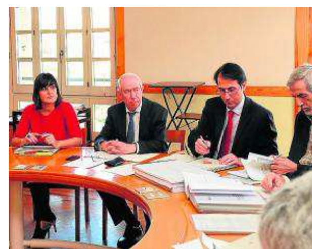
Un momento del encuentro. S. E.