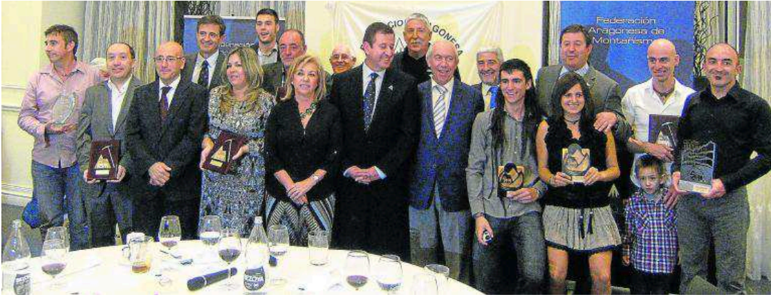
Grupo de premiados y autoridades en la XIX Cena de la Montaña.