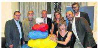
El equipo de trabajo de CIMA 2015 con el logotipo del congreso.

escalada o ha sido campeón de Aragón durante varios años consecutivos, sigue colaborando y compitiendo. La consejera de Educación, Universidad, Cultura y Deporte, Dolores Serrat, le entregó el preciado galardón, cerrando el acto con unas palabras de ánimo y aliento hacia todos deportistas y federados, que año tras año van consiguiendo poner Aragón en el mapa del mundo, y animó a la federación a seguir trabajando en la preparación del congreso internacional CIMA, que se está organizando para el mes de marzo de 2015.