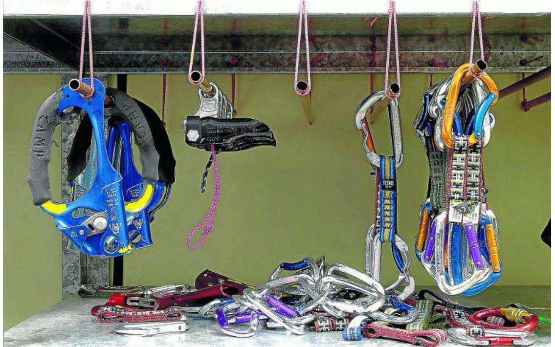
Material de escalada de la Escuela de Montaña de Benasque, de la FAM. PRAMES

Los materiales de montaña protegen de caídas desde cierta altura. Son, bajo un punto de vista normativo, Equipos de Protección Individual (EPI). De todos los EPI existentes, el material de montaña se incluye en la categoría 3, ya que son EPI que protegen de riesgos muy graves o mortales. En este tipo de EPI, el fabricante debe superar controles externos de calidad por parte de los llamados Organismos Notificados. Si se tiene a mano, por ejemplo, un mosquetón, después de las letras CE, aparecen 4 dígitos que corresponden a estos organismos. El fabricante, con el visto bueno de los Organismos Notificados, elabora una Declaración de Conformidad CE, y ya puede poner el marcado CE a su producto.