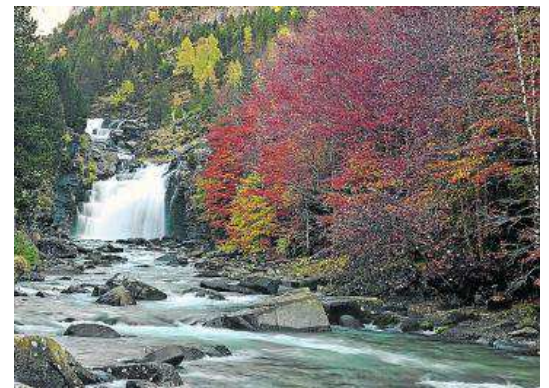
Valle de Ordesa. JAVIER ROMEO

Gran Vía, 11. 50006 Zaragoza. Tel.: 976 236 355. Fax: 976 236 439. www.montanerosdearagon.org administracion@montanerosdearagon.org Senderismo Fecha: 2 de noviembre. Lugar: Nocito-San Úrbez-La Pillera.