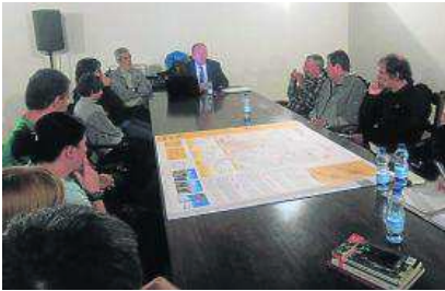
Mesa redonda del sábado.

Os Andarines d'Aragón tomaron el testigo de la organización del próximo Día del Senderista, que será de ámbito nacional y se encuadrará en los actos de CIMA 2015, el Congreso Internacional de Montañismo, a celebrar en Zaragoza del 26 al 28 de marzo.