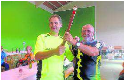
La AD Maestrazgo pasa el testigo a Os Andarines.