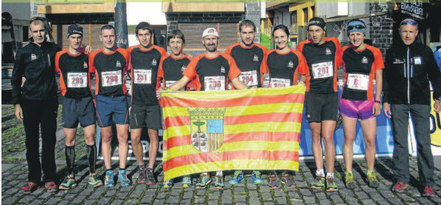
Los miembros de la selección de Carreras por Montaña de Aragón, de la FAM. FAM

La temporada de carreras por montaña para la selección de Aragón ha terminado. Buen momento para echar la vista atrás y revisar todo lo sucedido y vivido a lo largo de estos intensos ocho meses.