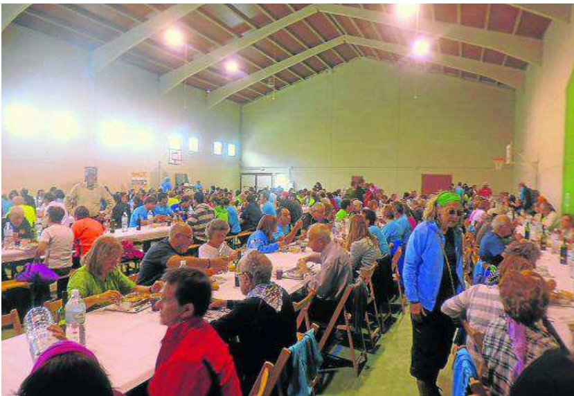
La comida de hermandad fue muy concurrida.

más alto de esta ruta. Es por ello que fuimos bajando por roquedo hasta salir a una pista, que ya por el PR TE-73, bordea unos campos sobre el lomo de un monte, que deja libres las vistas a derecha e izquierda, por donde fuimos viendo, más cerca de lo que nos hubiese gustado, unos nubarrones en plena actividad, con relámpagos y truenos que no entienden de calendarios.