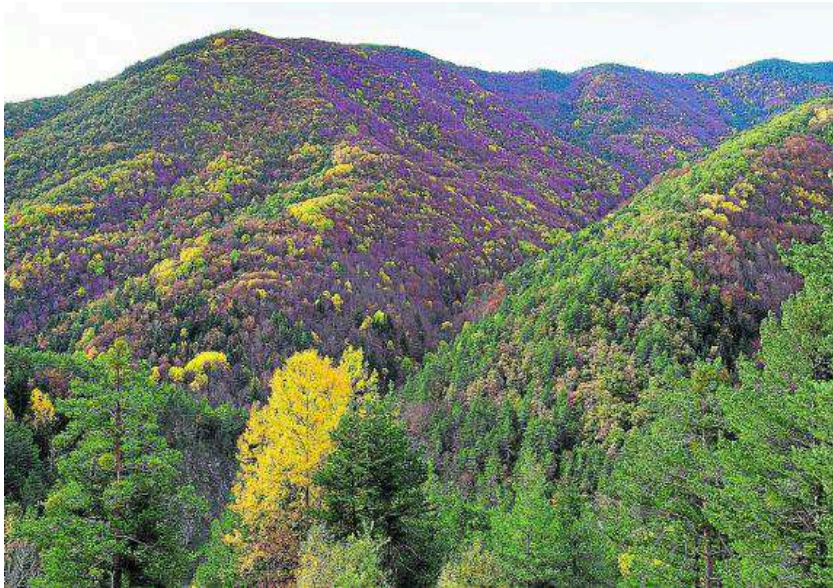
Vista panorámica del bosque de la Pardina del Señor en otoño. RICARDO POLO

EXCURSIÓN | EL GR 15 se adentra en la magia del bosque otoñal entre Fanlo y Broto