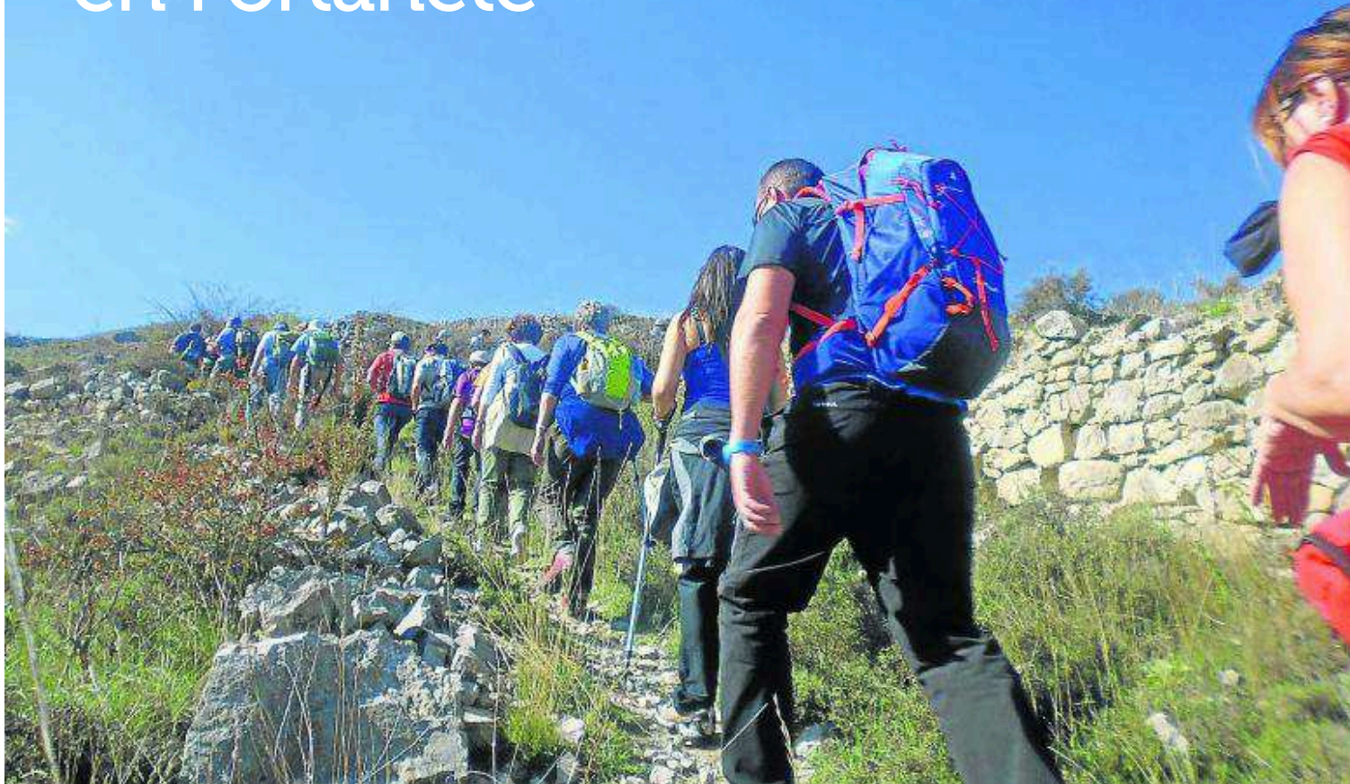
Participantes en el XVI Día del Senderista de la FAM, en tierras de Fortanete.

La FAM organiza anualmente el Día del Senderista. Con la de este año ya son 16 las ediciones celebradas, en torno al senderismo y siempre polarizadas entre el sendero y el senderista. Esto, que parece un trabalenguas, encierra esta doble vertiente. Por un lado, el campo de juego, los caminos, los senderos, puestos en valor muy poco a poco, pero con una decidida vocación de continuidad, gracias al nuevo decreto de Senderos Turísticos de Aragón y su flamante señalización. Y por otro, el jugador, el senderista, que día tras día, semana tras semana, se va dejando el sudor por esa red de senderos de Aragón.