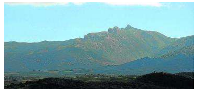
Peñas de Herrera. PRAMES