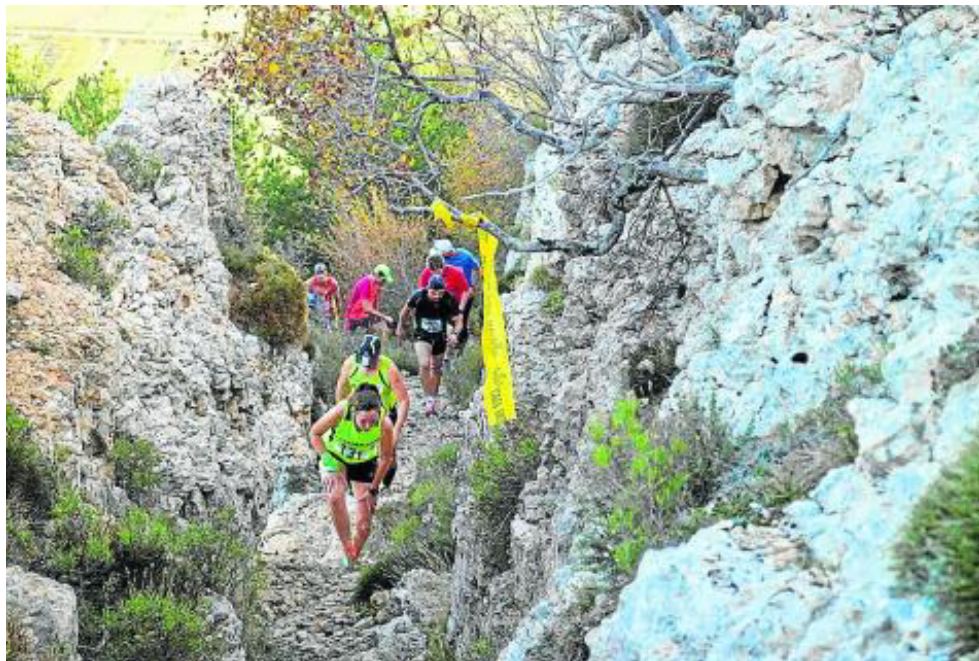
Un momento de la carrera.