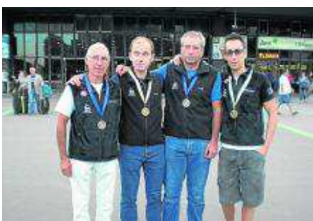
Miembros del equipo de Paraescalada de la FAM. FAM

Este sábado 25 de octubre se celebrará la VI Fiesta del Chopo Cabecero, en Blesa y Huesa del Común, que incluye una excursión por los estrechos del río Aguas Vivas.