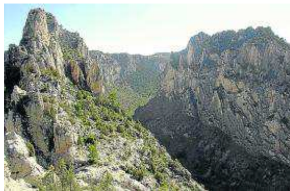
Hoces del Guadalope desde Valloré. D. M.