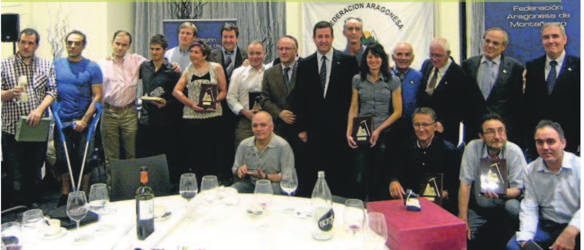
Grupo de galardonados de la Cena de la Montaña de 2013. MARIANO ADÁN

El próximo 24 de octubre, se celebrará, como ya viene siendo habitual, en el Hotel Reino de Aragón de Zaragoza, la XIX Cena de la Montaña. Esta gran cita de la Federación Aragonesa de Montañismo logra reunir todos los años a varias generaciones de montañeros y amantes de la aventura, así como a representantes de colectivos vinculados con el mundo de la montaña, como guardas de refugios, miembros de los GREIM, SOS Aragón y representantes de algunos de los departamentos del Gobierno de Aragón vinculados con el mundo del montañismo.