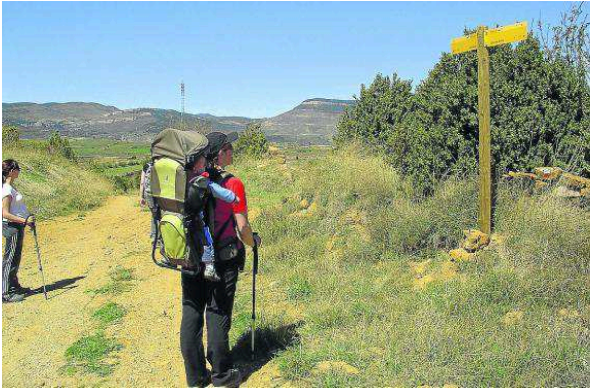
Senderistas por el GR 8, entre Cantavieja y La Iglesuela del Cid. DIEGO MALLÉN

Ante el valor del GR 8, la Dirección de Turismo del Gobierno de Aragón ha actuado en alguno de sus tramos al amparo de decreto que regula aquellos senderos de Aragón que revisten la condición de recursos turísticos.