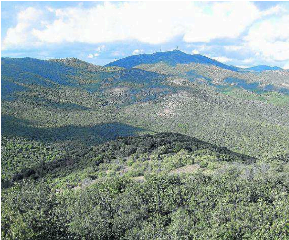
Pico de Valdemadera visto, desde el Sureste, ante el puerto de Codos. MODESTO PASCAU

T obed (637 m) es el punto de partida del GR 90.3. Esta localidad se abandona por su extremo NE, coincidiendo en un primer momento con el tramo 2 del GR 90. Tras cruzar el puente sobre el río Grío, se llega al desvío donde el GR 90 se separa a la izquierda, en dirección a Santa Cruz de Grío.