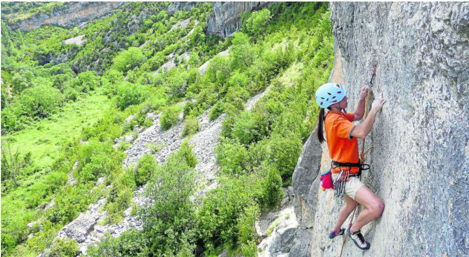
Entrenamiento del GTEDA al aire libre.