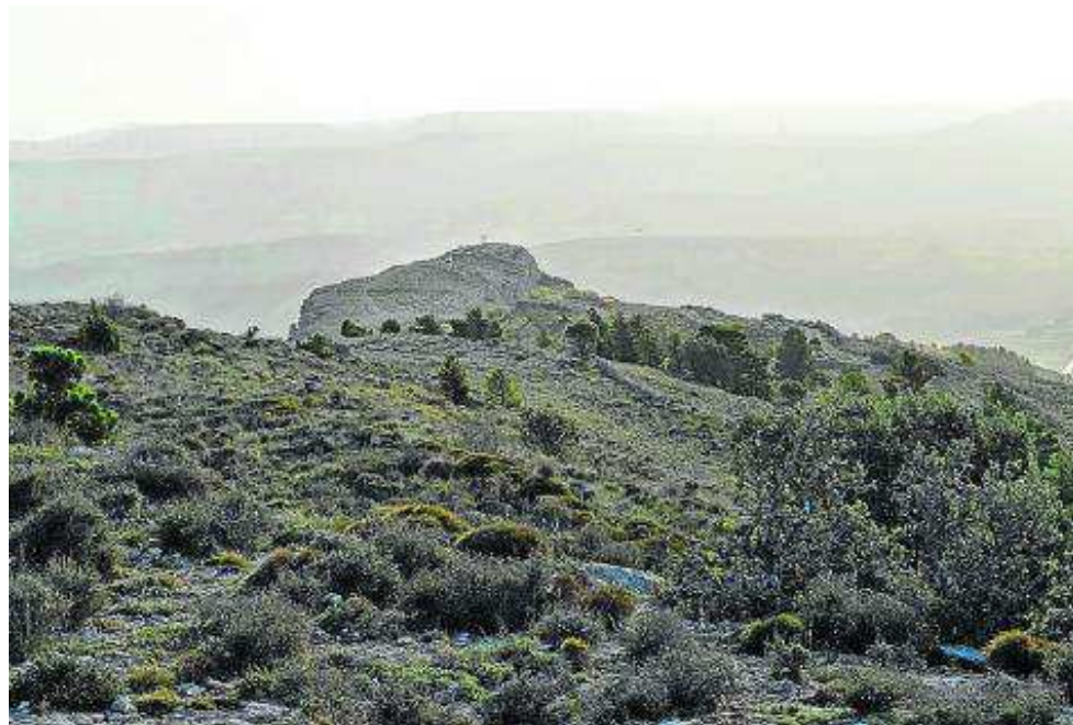
Uno de los puntos de avituallamiento, al fondo.