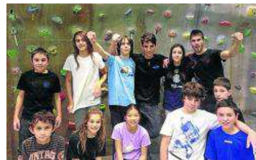
Miembros del GTEDA-FAM. GTEDA-FAM