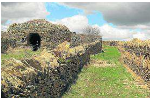
Ruta de la Piedra Seca de La Iglesuela del Cid. D. M.