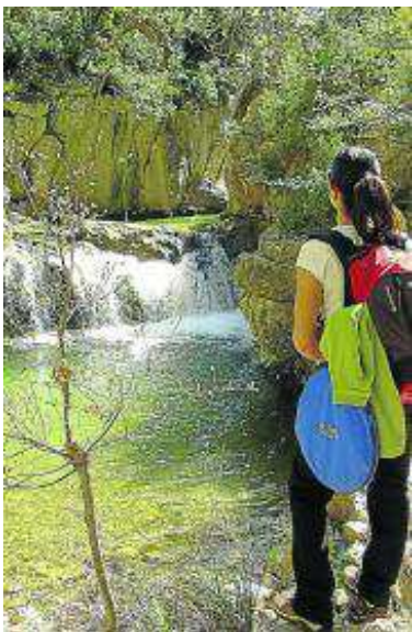
Entorno del pozo del Invierno, en Villarlengo.

suela, Fortanete-Cañada de Benatanduz y Cantavieja-Mirambel. Con estas y futuras actuaciones, el GR 8 está llamado a convertirse en una de las rutas más atractivas y seguras, desde el punto de vista senderista, de la península.