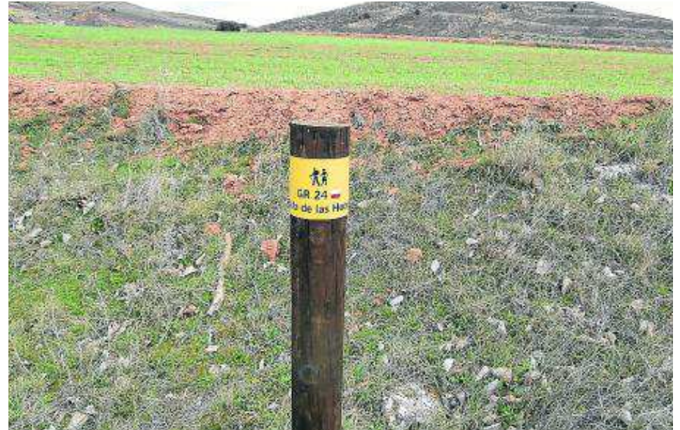
Nueva baliza en el GR 24.