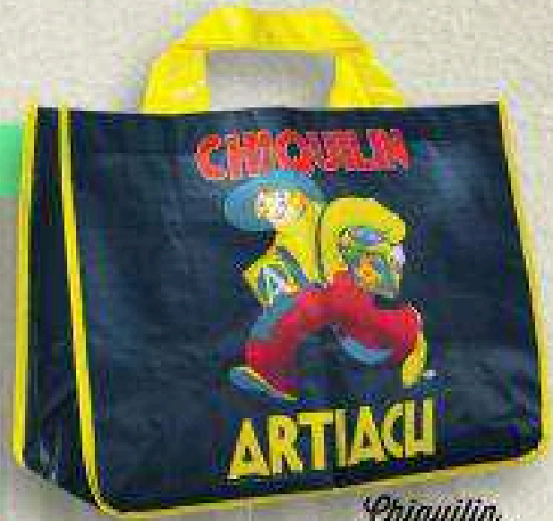
Chiquilin + Paquete de galletas 2 DE NOVIEMBRE