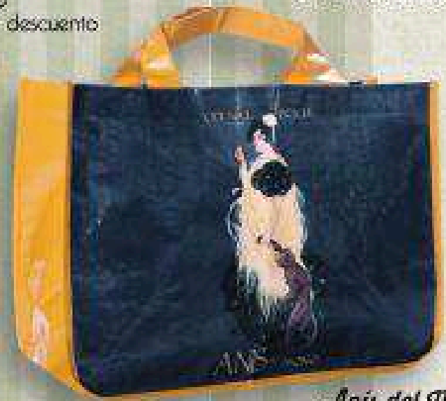
Anís del Mono 23 DE NOVIEMBRE