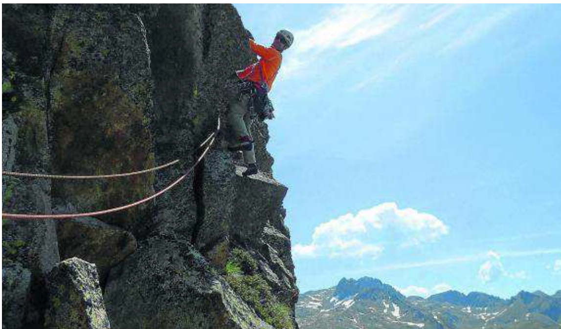
El granito es el protagonista. LUIS ROYO