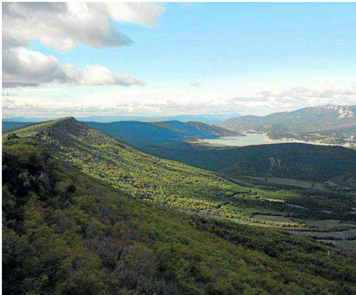
Sierra Nobla desde la Peña Musera, con el embalse de Yesa al fondo. FERNANDO LAMPRE

Ascensión a una atractiva punta de la desconocida sierra Nobla, la Peña Musera, que con sus 990 m se erige en uno de los mejores miradores panorámicos naturales hacia la Canal de Berdún y el valle de Los Pintanos.