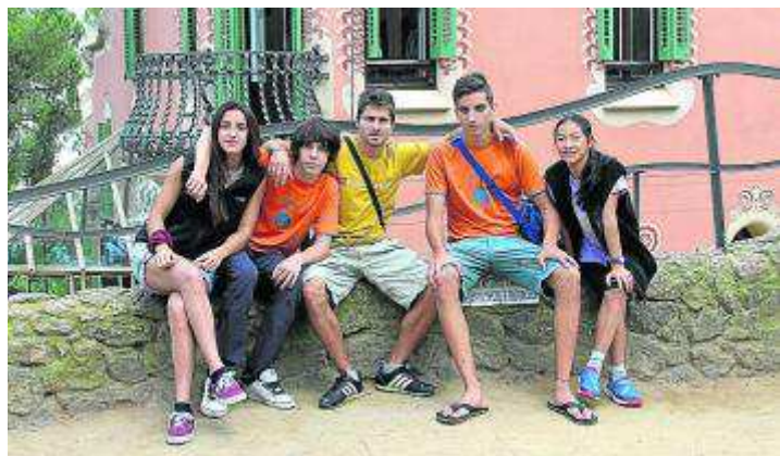
Miembros del GTEDA.