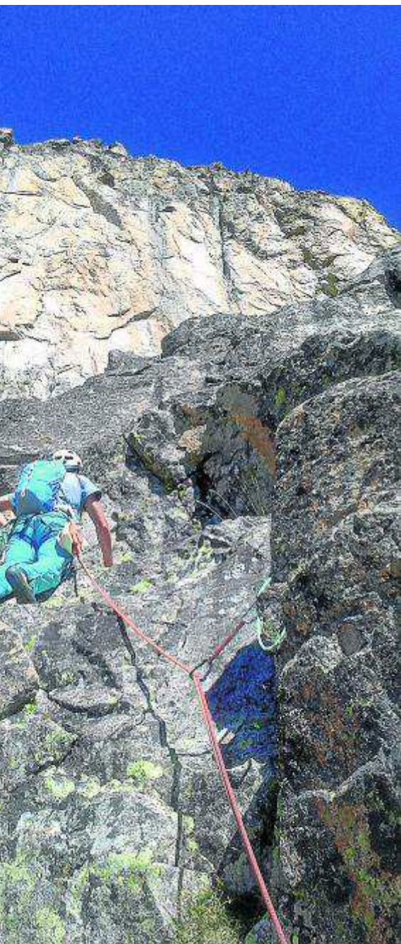
Escalando la Aguja de Bachimaña. A. ESTRADA

La roca es granito de calidad. El equipamiento, con parabolts (métrica 8 y 10 mm), puentes de roca, algún clavo y algún árbol. Las vías se distribuyen de forma escalonada en las proximidades del GR 11, entre el balneario y los lagos de Bachimaña.