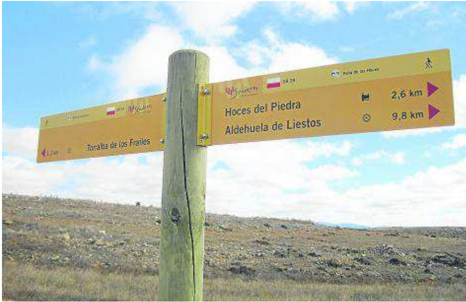
La nueva señalización facilita la visibilidad y la lectura.