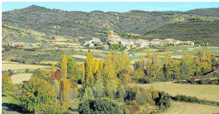
Vista general de Undués-Pintano.

Poco a poco este vial se había convertido en una trocha y, a partir del mencionado arroyo -a lo largo de una pista de petroleros muy empinada indicada mediante unas marcas rojas de seguimiento-, el camino asciende hasta un collado, en plena sierra Nobla (900 m; 4,7 km; 1 h 35 min).