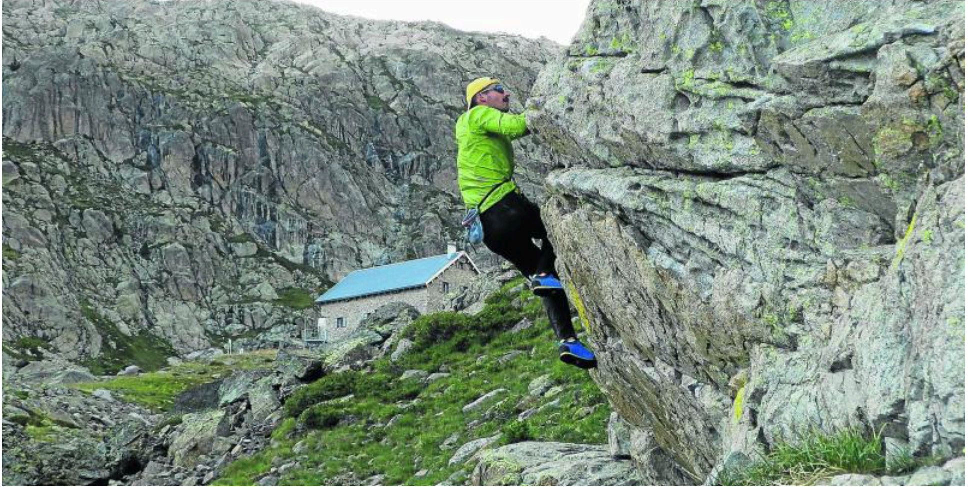
Zona de boulder próxima al refugio de Ibones de Bachimaña que, junto al de Casa de Piedra, son la base de operaciones. LUIS ROYO

ESCALADA | Nuevas vías de escalada en torno al balneario de Panticosa