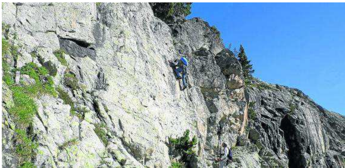
Las vías en el entorno del balneario de Panticosa están pensadas para 'todos los públicos'. LUIS ROYO