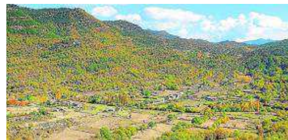
Valle de Nocito. PRAMES

Fecha: 19 de octubre. Lugar: Agüero-Longás.