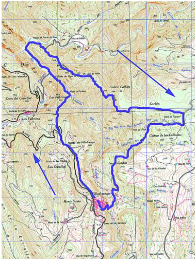
Ruta preparada para el sábado.

El día fuerte es el domingo, con las tres rutas de la FAM. La de mayor duración servirá para celebrar la 'Marcha regional de veteranos' y la más corta está dirigida a chicos y chicas a partir de los 4 años de edad, y es ideal para hacer en familia. En todas ellas se contará con voluntarios