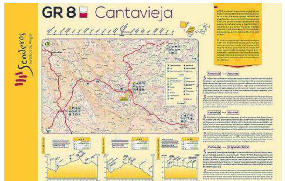
Los paneles siguen la misma imagen que las señales.

El Decreto 159/2012, del Gobierno de Aragón, regula los senderos de Aragón que revisten la condición de recursos turísticos, infraestructuras sobre las que se desarrollan actividades deportivas que participan del tránsito por dichos senderos, sea a pie, en bicicleta o a caballo, en auge desde hace años.