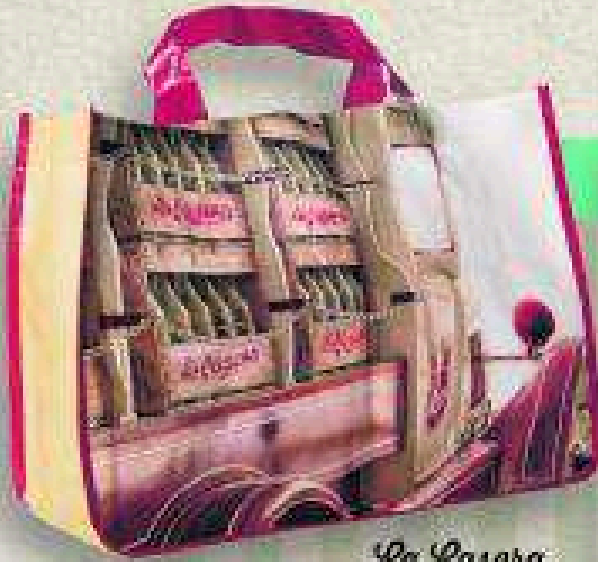
La Casera 19 DE OCTUBRE