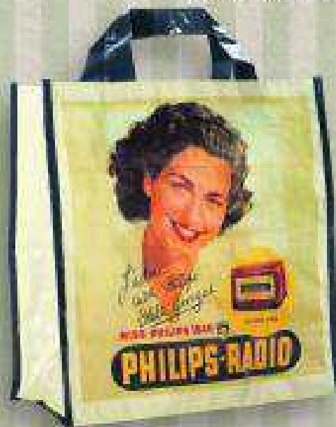
Philips + vale de 25% de descuento 16 DE NOVIEMBRE