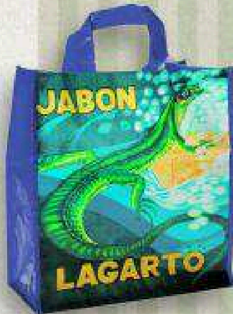
Lagarto + Pastilla de jabón natural 9 DE NOVIEMBRE