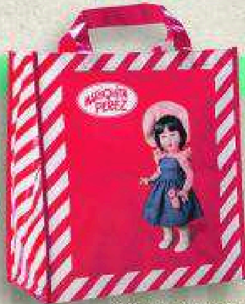
Mariquilla Pérez + vale de 20% de descuento 26 DE OCTUBRE