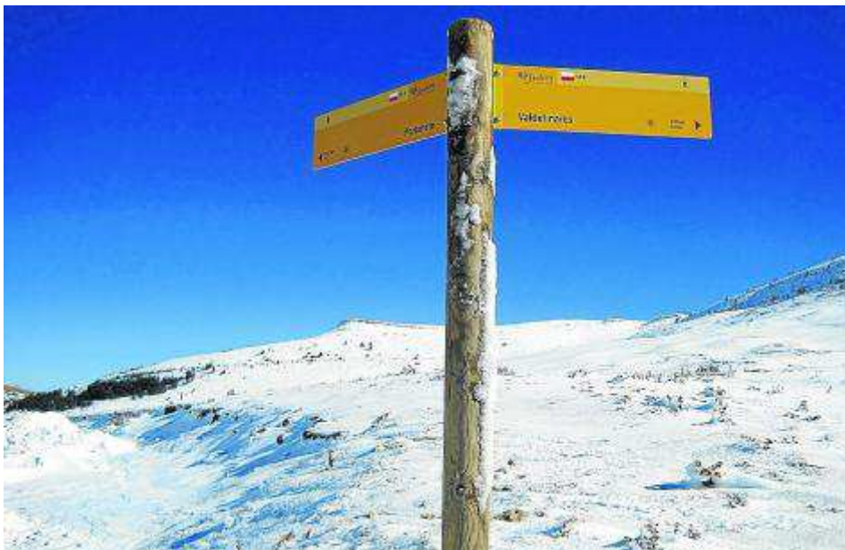
Los materiales escogidos buscan la durabilidad de las señales.