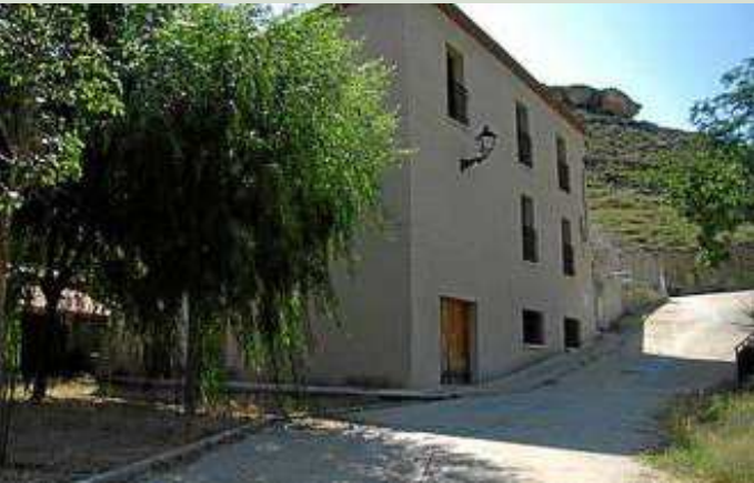
Albergue de Obón cuenta con treinta plazas.

Por estar en la mitad del recorrido propuesto, este albergue es un punto idóneo para realizar la excursión en dos etapas.