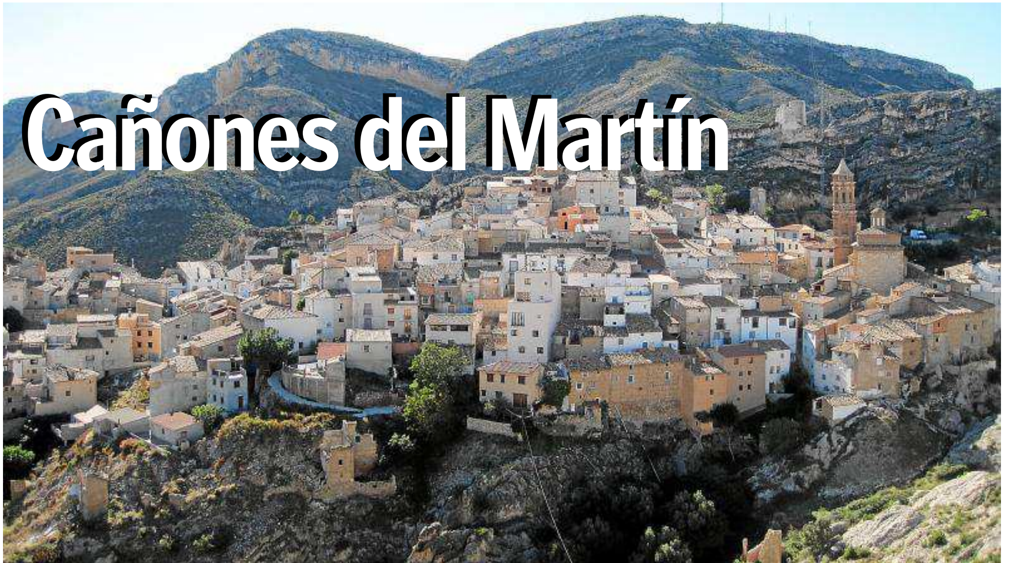
La localidad de Alcaine, punto de partida de una de las rutas de esta excursión, se sitúa sobre una cresta rocosa. PRAMES

EXCURSIÓN | Alcaine, Obón y Peñarroyas son las localidades que une esta espectacular ruta por el Parque Cultural del Río Martín