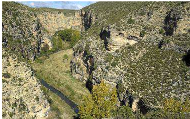
Estrechos junto al barranco del Regallo.

Alcaine es una de las localidades más sugestivas de Aragón, con un casal dispuesto en fuerte gradierío, entre los precipicios de los ríos Radón y Martín y rodeado de torreones medievales. El panel de la ruta está situado en el aparcamiento que hay a la entrada de la población (657 m). Hay que atravesar el pueblo para abandonarlo por la cuesta empedrada de San Ramón, alcanzando la pista de hormigón que