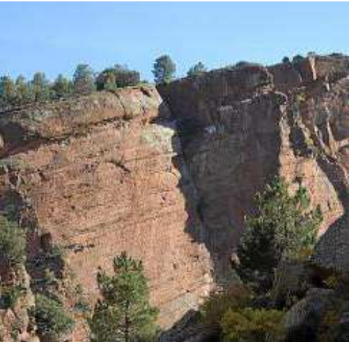
s de Peñarroyas. PRAMES

El paisaje rocoso arañado por el Martín ha configurado profundos cañones, en los que destaca la fauna rupícola que los habita: aviones roqueros, chovas piquirrojas, alimoches, águilas y búhos reales y, sobre todo, buitres leonados.