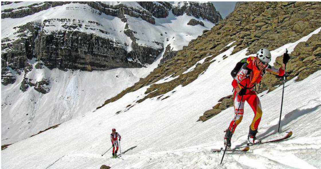
Esquiadores en uno de los tramos de la Travesía Valle del Aragón celebrada el año pasado. RAMÓN BELLERA

N uevamente los esquiadores de todos los niveles se lanzan a la nieve en lo que será la última prueba aragonesa de la temporada. Con la ayuda y la organización de la Asociación Deportiva de Competiciones de Montaña (ADECOM), finalizará el calendario FAM de competición de esquí de montaña 2012, patrocinado por Aramon.