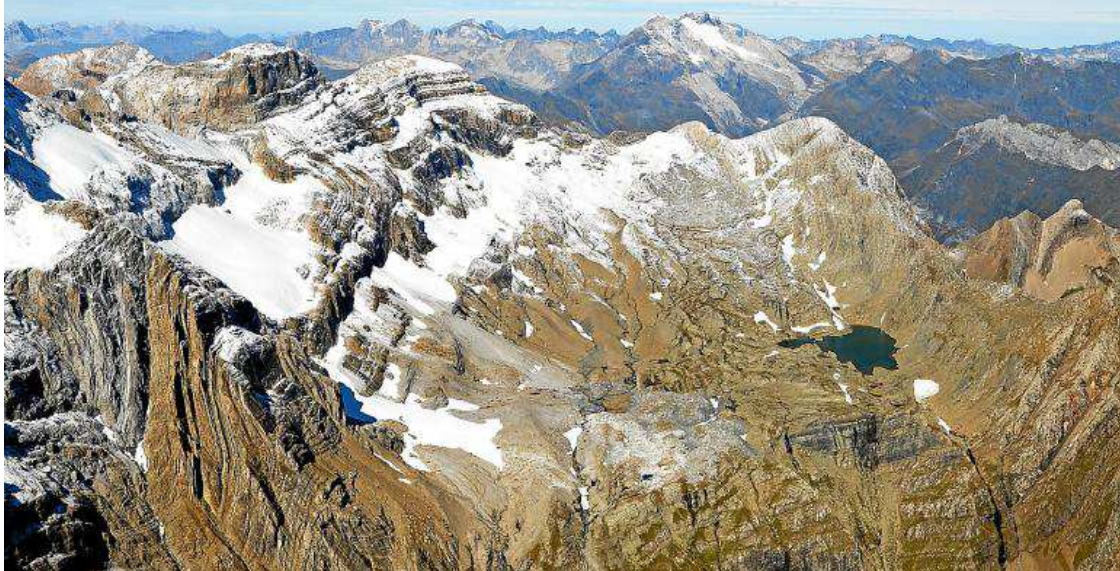
Una imponente vista aérea del Cilindro y del ibón de Marmorés.

La observación, estudio o disfrute de los ibones y glaciares conlleva la realización de itinerarios de alta montaña. Muchas de las rutas que llegan hasta ellos solo son practicables para los senderistas durante los meses estivales. La longitud, el desnivel y las características del terreno son duras, por lo que es necesario tener una buena forma física, extremar las precauciones e incluso, a veces, permanecer en la montaña durante más de una jornada. Así, el itinerario descrito hace referencia al estado de la montaña estival –las condiciones de mal tiempo, invernales o de innivación elevan notablemente la dificultad-. Los clubes de montaña o los guías profesionales son el mejor aval cuando no se tienen los conoci-