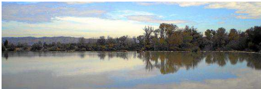
Vista del agua embalsada del río Ebro en la presa de Pina.

Lectura recomendada: 'Camino Natural del Ebro GR 99. Fontibre-Faro del Garçal', Ministerio de Medio Ambiente. Secretaría General para el Territorio y la Biodiversidad, Prames, 2007.