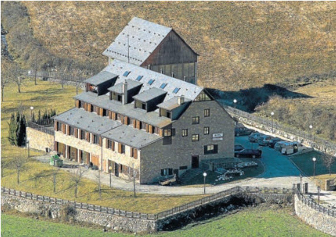
Las instalaciones de la Escuela de Montaña de Benasque están en una ubicación privilegiada.

Su privilegiada infraestructura puede alojar distintos perfiles de usuarios (montañeros, escaladores, barranquistas o excursionistas), así como crear un lugar idóneo para realizar actividades formativas.