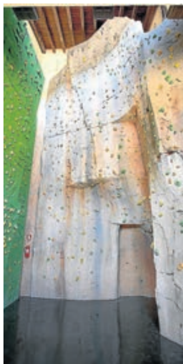
Rocódromo de Alquézar. PRAMES

Las dos escuelas están homologadas como centros de formación para impartir las enseñanzas de Técnicos Deportivos de Montaña y Escalada, ya que presentan las