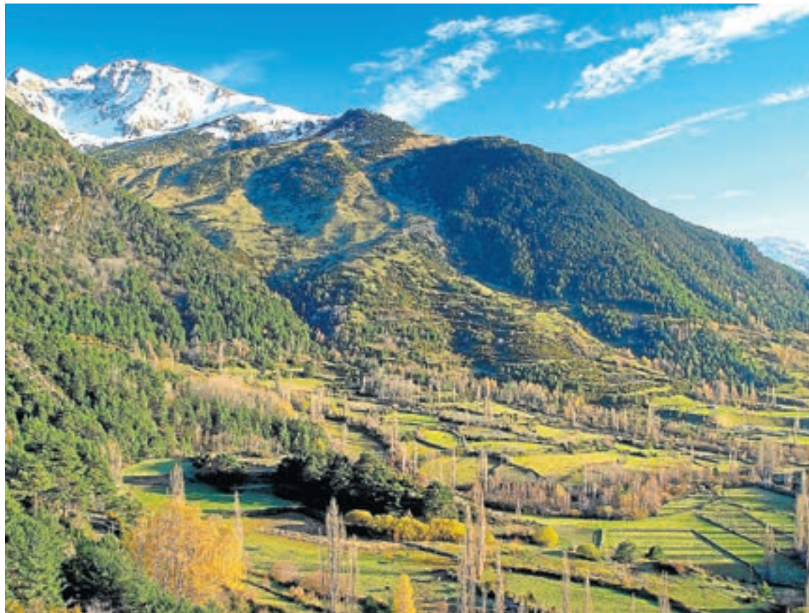
Vista panorámica desde la pista que conduce al embalse de la Sarra, al inicio de la ruta.

La ruta comienza en Sallent de Gállego, donde se toma la carretera que asciende al embalse de la Sarra por un bosque mixto de especies caducifolias: tilo ( Tilia platyphyllos ), avellano ( Corylus avellana ), mostajo ( Sorbus aria ), olmo de montaña ( Ulmus glabra ), serbal de los cazadores ( Sorbus aucuparia ), fresno ( Fraxinus excelsior ), abedul ( Betula pendula ) o álamo temblón ( Populus tremula ). Tras aparcar el vehículo en la cola del embalse, se toma un camino en el puente de As Faxas y, remontamos el valle por el GR