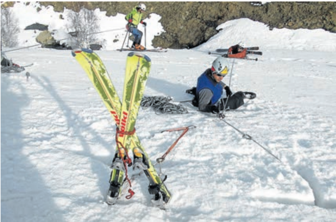
Prácticas en el curso de Técnico Deportivo de Alta Montaña.