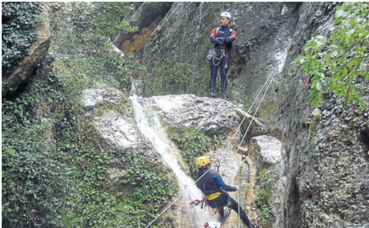
Rápel guiado en el curso de Técnico Deportivo de Barranco

E n Aragón tenemos el privilegio de contar con dos de las instalaciones mejor dotadas de España para la enseñanza de los deportes de montaña y escalada. Se trata de la Escuela de Montaña de Benasque, cuya titularidad es del Gobierno de Aragón, y la Escuela Refugio de Alquézar, de la Federación Aragonesa de Montañismo, aunque ambas sean gestionadas por esta última entidad. Están ubicadas en dos entornos diferentes; en el Pirineo, la primera, y en la sierra de Guara, la segunda, cuestión que les proporciona un carácter todavía más polivalente, incluso complementario, y en cualquier caso difícilmente mejorable para la práctica y enseñanza de las modalidades deportivas afines.