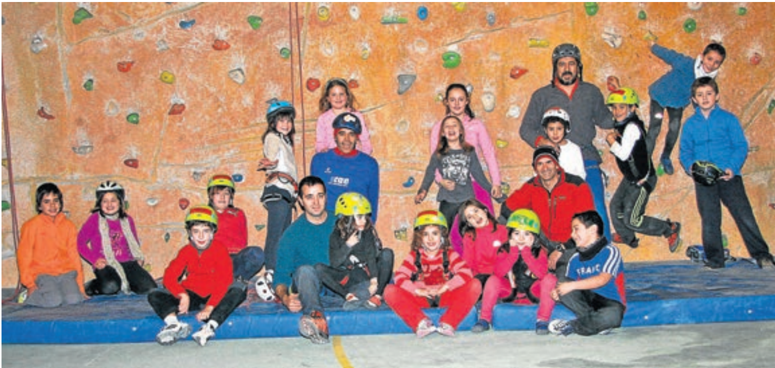
La escuela de escalada de Ejea de los Caballeros cuenta con una numerosa participación. C.M. EXEA

El fin de semana del 12 y 13 de mayo, el Club de Montaña Exea se embarca de nuevo en un reto. Esta vez no se trata de una ascensión con desafíos extremos, ni simplemente de organizar un evento deportivo, sino de seguir manteniendo el recuerdo de un compañero que nos dejó en el Himalaya nepalí.