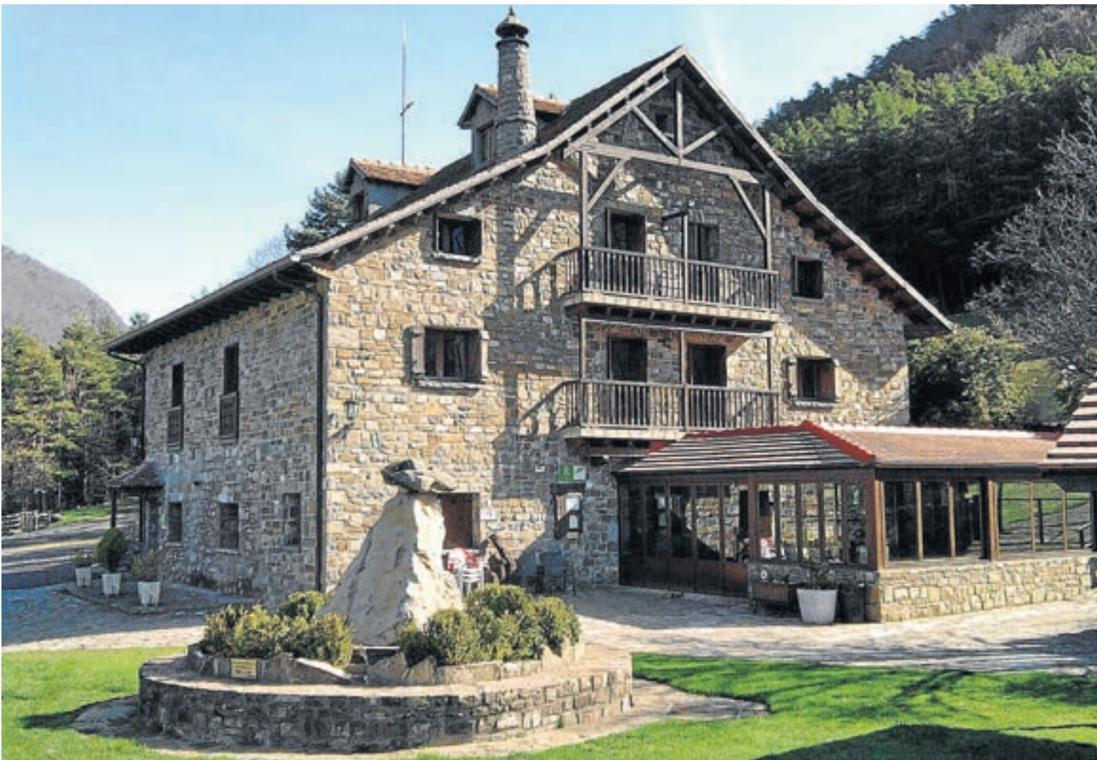
La borda Bisaltico es uno de los establecimientos asociados.

El pasado sábado 12 de mayo se cumplió el segundo aniversario de la puesta en marcha de la web alberguesyrefugiosdearagon.com . Los datos, en cuanto a visitas y reservas, que se han registrado en este periodo posibilitan que este segundo cumpleaños se celebre de una forma muy especial.