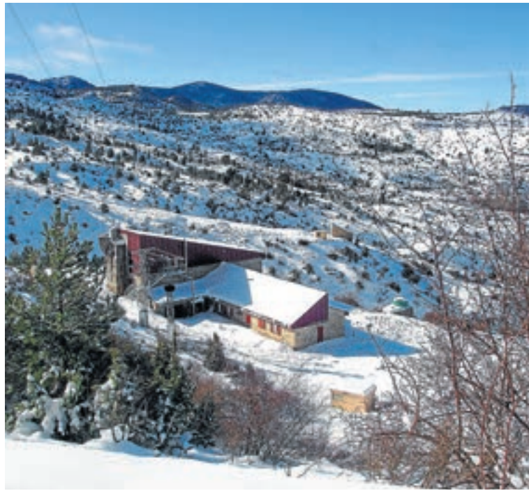
El refugio Rabadá y Navarro, en un magnífico entorno. DANIEL TORTAJADA