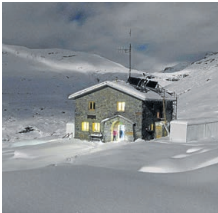
Estampa nocturna del refugio de Góriz.