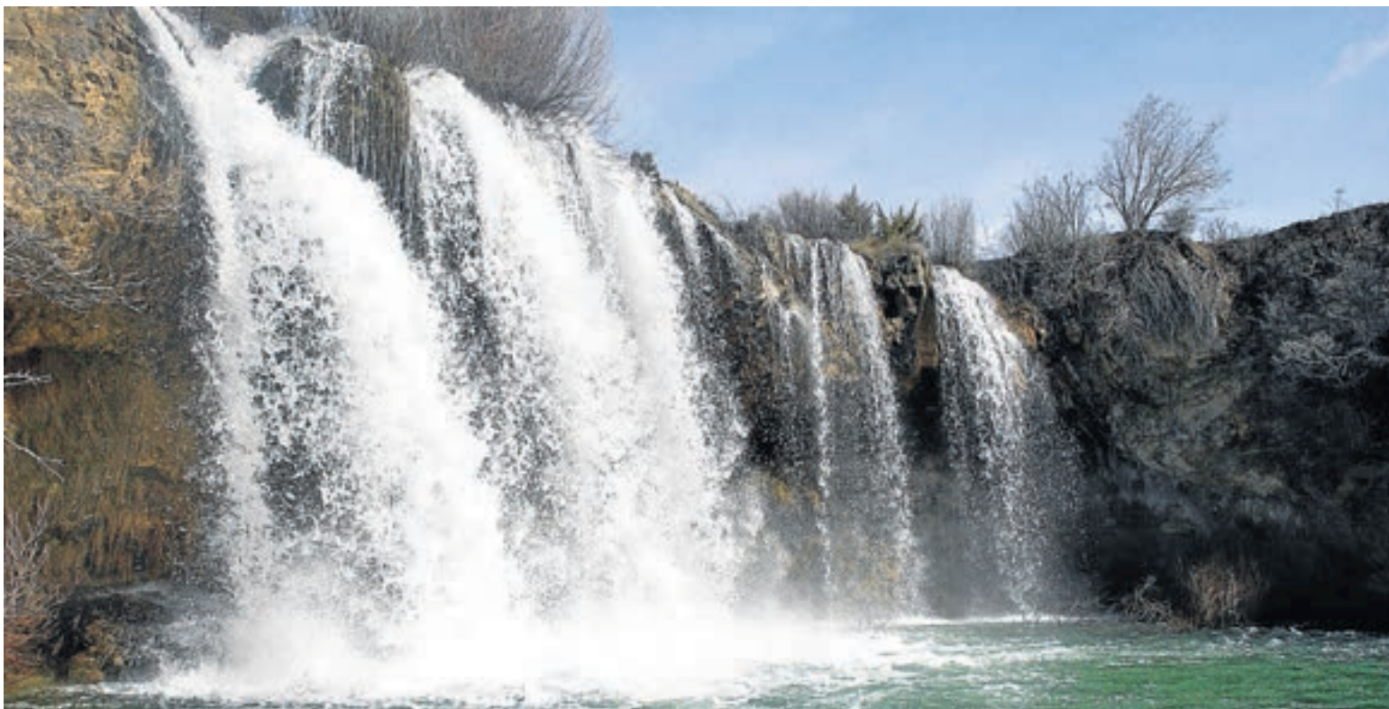
La cascada del Molino de San Pedro es un rincón poco conocido de la comarca de la Sierra de Albarracín.

A l sur de la sierra de Albarracín, en una escarpada ladera junto al río Cabriel, aparece el típico núcleo de montaña con viviendas en piedra. Se trata de la localidad de El Vallecillo. Muy cerca de aquí, se encuentran dos espacios naturales de interés, los ojos del río Cabriel y la cascada del Molino de San Pedro, ambos enmarcados dentro del Lugar de Importancia Comunitaria (LIC) de Valdecabriel-Las Tejeras, una zona de alto interés paisajístico y natural, aunque todavía algo desconocida.