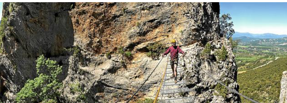
cular puente en la vía ferrata de Foradada de Toscar. PRAMES

En el marco de esta estrategia, una de las líneas de acción ha sido crear una red de vías ferratas ubicadas en diferentes puntos. En estos momentos, existen cuatro vías ferratas: la de Foradada del Toscar, situada al oeste de comarca y cerca de la población del mismo nombre; las de Sesué y el Sacs, en el valle de Benasque y, por tanto, al norte; y esta última, de la Croqueta, en el congosto de Obarra, en el centro de la comarca.