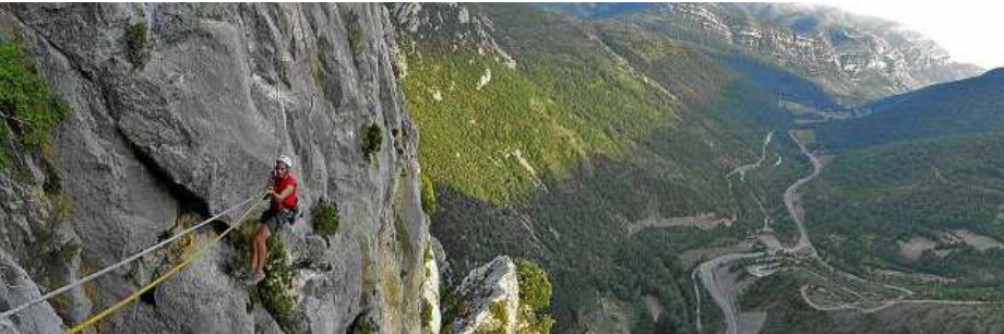
ta de la Croqueta, promovida por el Plan de Competitividad Turística de La Ribagorza. PRAMES

Estos itinerarios buscan transmitir sensaciones verticales sin los requerimientos físicos y técnicos de la escalada en roca; además posibilitan el conocimiento y disfrute de los parajes y ecosistemas más inaccesibles.