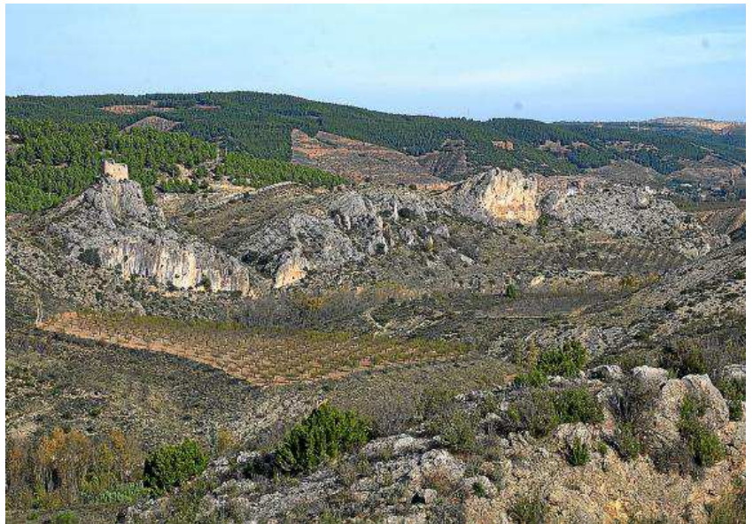
Paisaje de un tramo del río Huerva a los pies del castillo de la Casaza.

E ste recorrido parte desde la misma localidad de Tosos y discurre a través de un tramo del río Huerva rodeado de escarpes rocosos, bosque de ribera y pequeños cultivos de regadío, hasta llegar a la presa del embalse de las Torcas. A lo largo del recorrido podremos observar varias especies de rapaces rupícolas y, con suerte, algún rebaño de cabra montés.