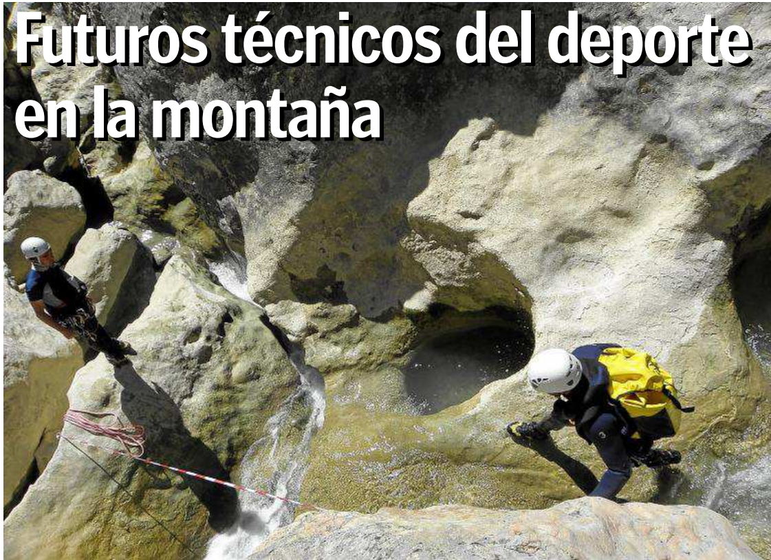
Un momento de las pruebas de acceso en la especialidad de Barrancos. TDME