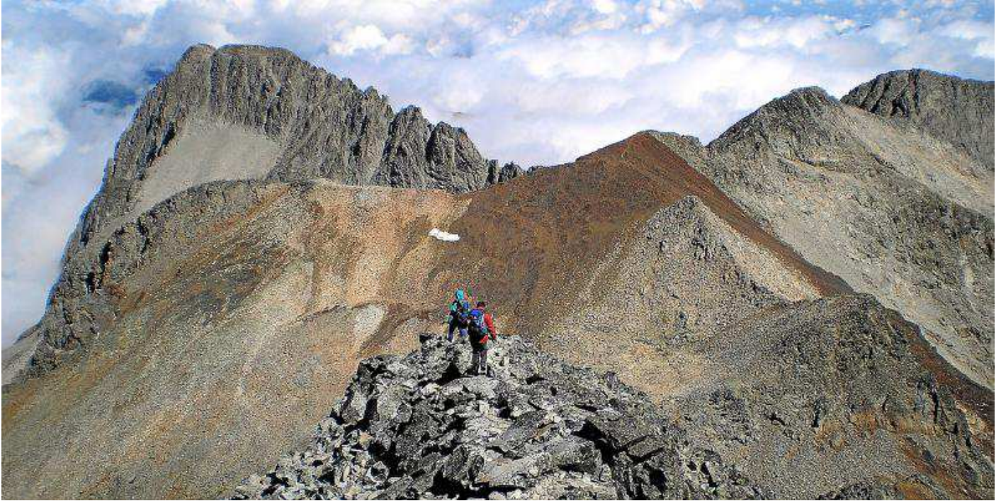
Montañeros descendiendo de la cima del pico Perdiguero (Benasque).

El pasado año 2010 el Consejo Asesor Científico de las Montañas de la Federación Española de Deportes de Montaña y Escalada organizó en Córdoba, en la sede del Instituto de Estudios Sociales Avanzados (CSIC), la III Jornada 'Ciencia y Montañismo', que trató sobre 'Nuevos modelos de gestión participada en los espacios naturales y áreas rurales', para lo que contó con la colaboración del Ministerio de Medio Ambiente y Medio Rural y Marino.