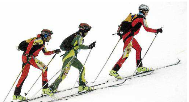
Momento de la XXVII Travesía de Esquí de Montaña Pirineos. FAM

dos los practicantes del esquí de montaña, tanto los experimentados corredores, que darán espectacularidad y emoción a la misma, como los participantes en la liga popular, que sin duda disfrutarán de una jornada deportiva y de reencuentro, consiguiendo entre todos el ambiente de las grandes pruebas. Desde aquí, os animamos a todos a participar.