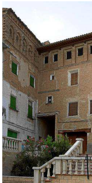
Caserón ubicado en la plaza de España, en Magallón.

La línea del ferrocarril que unía Borja con Cortes de Navarra se construyó en 1889, como medio rápido y eficaz para transportar mercancías agropecuarias (fundamentalmente vino y a partir de principios del siglo XX también remolacha), así como gentes y productos manufacturados, del interior a la ribera del Ebro. En 1955 tiene lugar la desaparición del ferrocarril y el abandono de la línea. En la actualidad su recuerdo es cada vez más vago, pero permanece el trazado de la línea, hoy convertido en camino agrícola y sólo conservado en el tramo Borja-Agón.