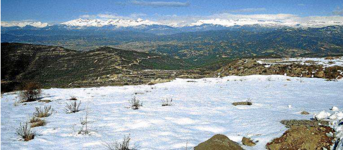
Vista panorámica desde el pico del Águila.

Se inicia la excursión en Arguis (1.043 m), donde es recomendable una visita al Centro de Visitantes del Parque Natural de la Sierra y Cañones de Guara 'Pascual Garrido'. Desde aquí se sube por la antigua carretera del Monrepós, que parte al oeste de la localidad. Aproximadamente a 1,1 km del pueblo y poco antes de llegar a la casa de Fondanito, se ve a la izquierda el indicador que señala el camino de la sierra de Bonés. Es posible dejar el vehículo cerca de donde comienza este sendero, en alguna de las pequeñas explanadas acondicionadas en el margen de la carretera.