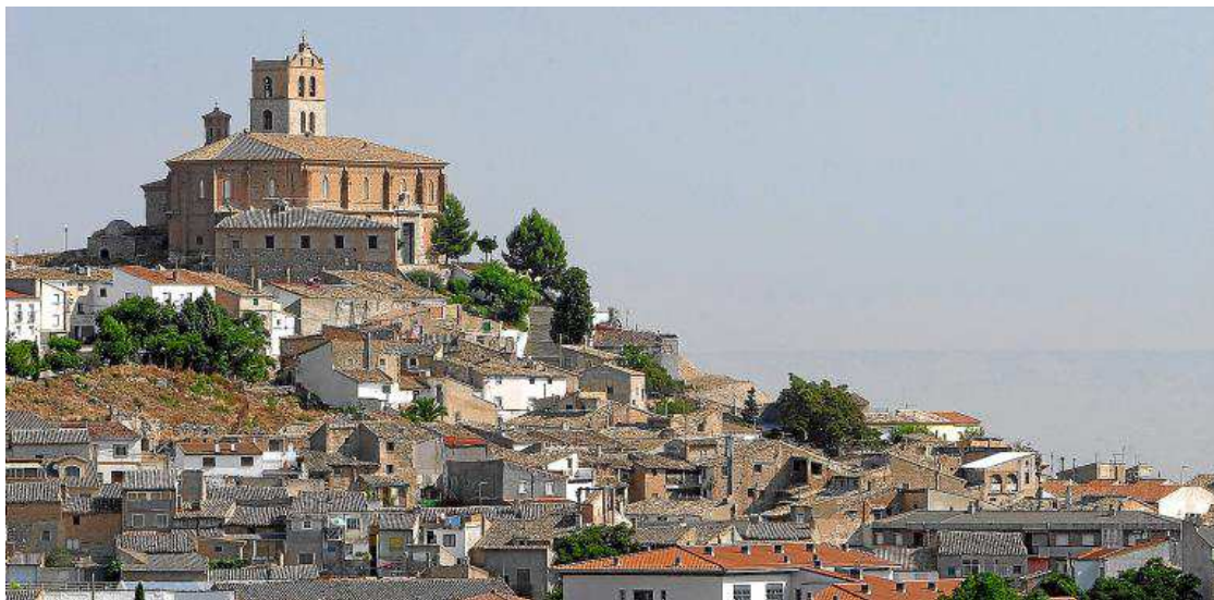
Vista general de Magallón.