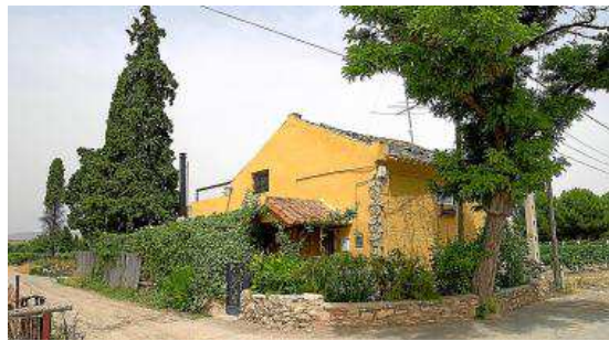
Antigua estación de Albeta.