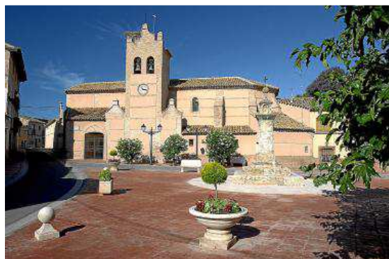
Plaza de la iglesia de Bisimbre.

hospital. El conjunto de calles de San Miguel fueron la antigua judería. Destaca la casa y escudo de los Ximenez y Ximenes y los sencillos ejemplos con galería de arquillos de los siglos XVI y XVII (nº 21, 23 y 25). La fachada del edificio nº III posee una hornacina que alberga una talla en madera de San Miguel, santo titular del barrio y que rememora la ermita que subsistió allí hasta el siglo XVIII.