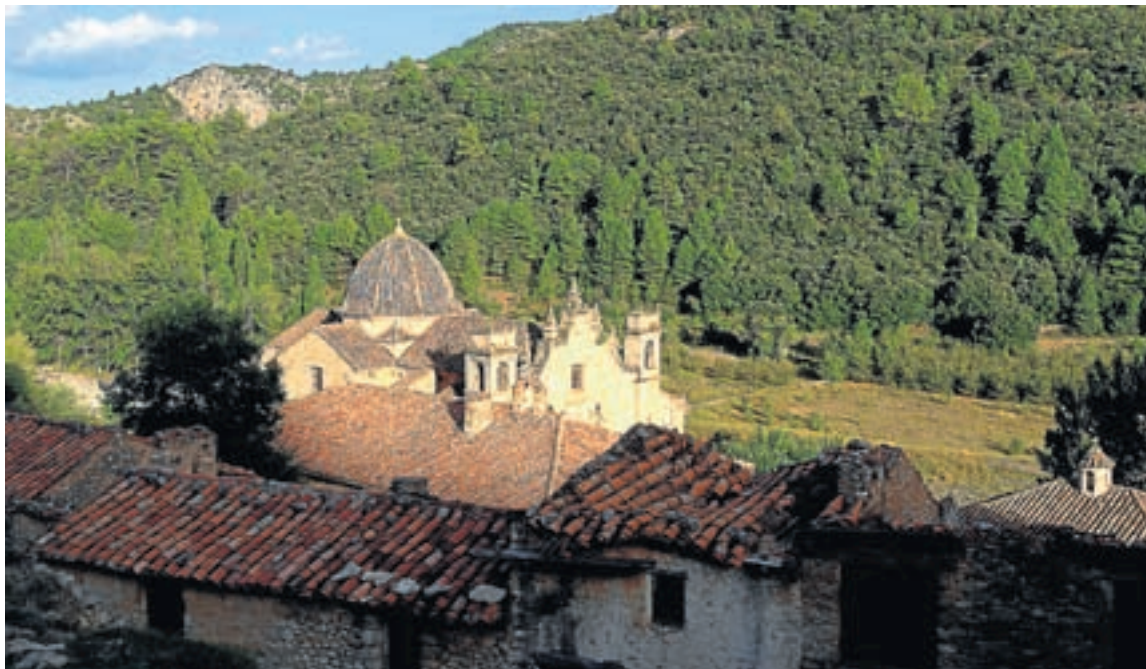
Vista sobre el santuario de la Estrella, en Mosqueruela.

Partimos de la villa de Mosqueruela, junto a la ermita del Loreto (1.470 m). A lo largo de este primer tramo de pista que discurre por la margen izquierda del barranco de la Horca, observaremos numerosos chozos, maestras construcciones pastoriles levantadas mediante la técnica de la