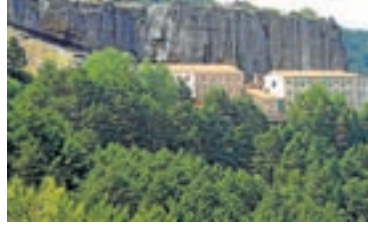
El santuario.

Hasta aquí, la marcha supone unos 40 min de recorrido, casi todo en descenso. Ahora, la pista, perfectamente trazada, atraviesa un bosque de roble rebollo y, tras él, el barranco de Morca. Después de unos 30 min alcanza una bifurcación en la que se continúa por la derecha. Unos 50 m después alcanza otra bifurcación en la que