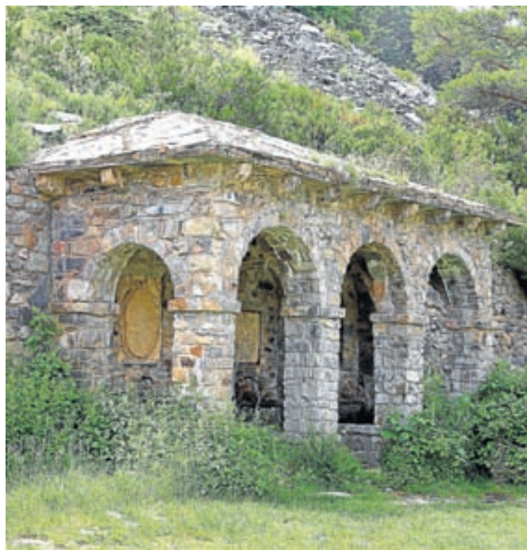
Fuente de San Gaudioso.