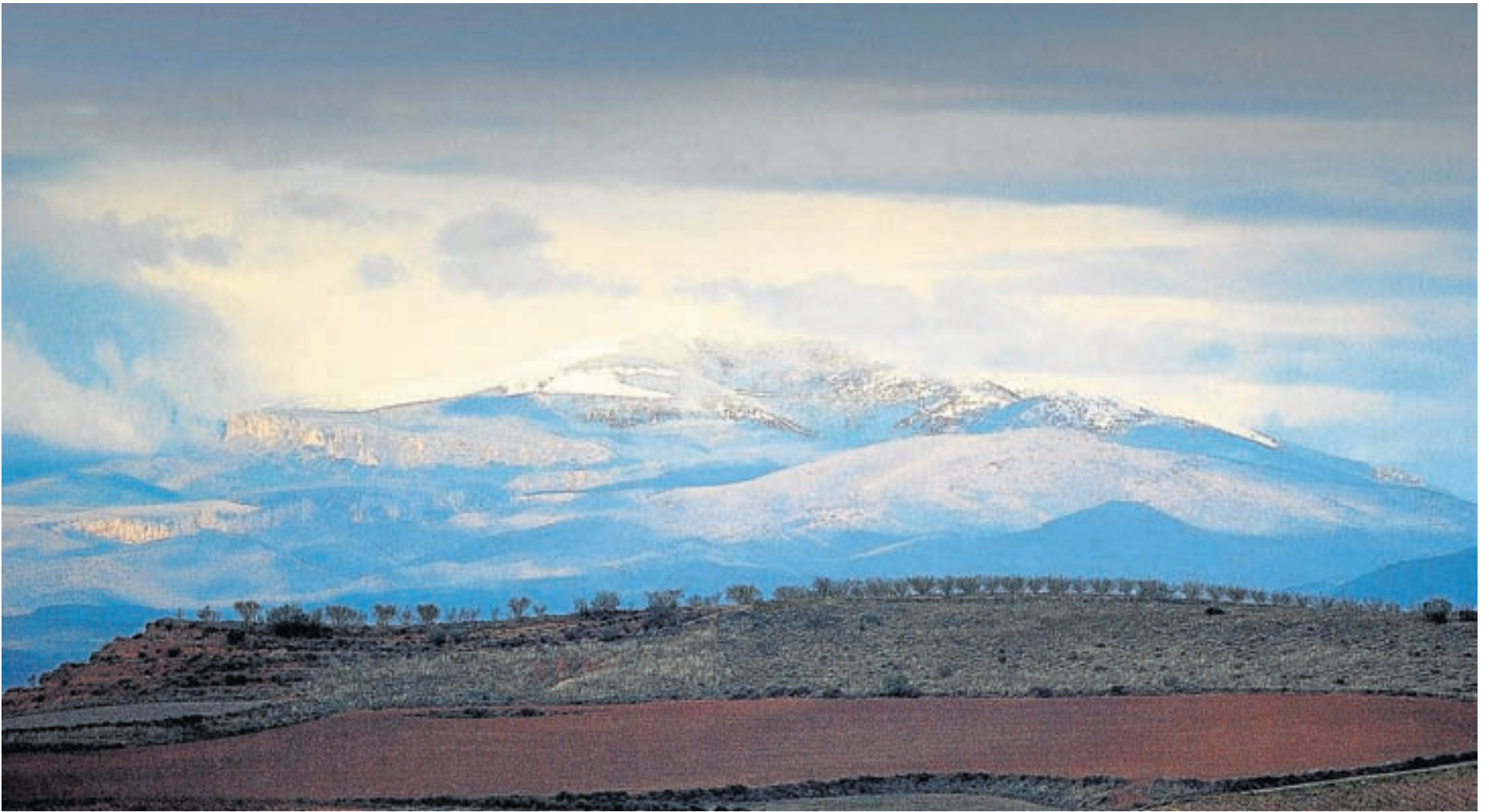
Panorámica de la imponente sierra del Moncayo, que establece una relación de enorme belleza cromática con el piedemonte.

E l itinerario que hoy se propone es una ruta circular de escaso desnivel, por sendas y pistas forestales, que permite realizar un completo recorrido por los bosques de las laderas del Moncayo. Es, por tanto, un agradable recorrido a la sombra de diferentes especies de árboles (pinos, hayas y robles) que, junto al sustrato arbustivo que crece a su abrigo, da buena idea de la riqueza vegetal que alberga el parque natural. Por otro lado, gran parte del itinerario está balizado con las marca blanquirrojas del GR 90, por lo que, además de cómodo, resulta fácil de seguir.