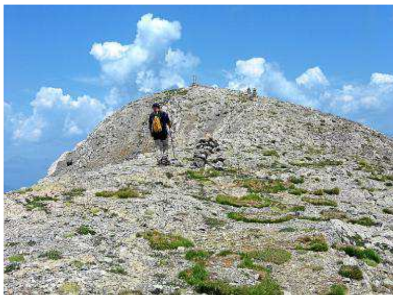
Subida por el barranco de San Adrián. MIGUEL ÁNGEL ACÍN

Consejos prácticos: calzado y ropa de montaña adaptados a la época del año (forro polar, chubasquero, cortavientos, gorra, gafas, crema de protección solar...) y comida para una jornada. Es necesario llevar agua, aunque en las fuentes de San Adrián y la Muria se puede llenar la cantimplora. Conviene no olvidar un botiquín, prismáticos y cámara fotográfica.