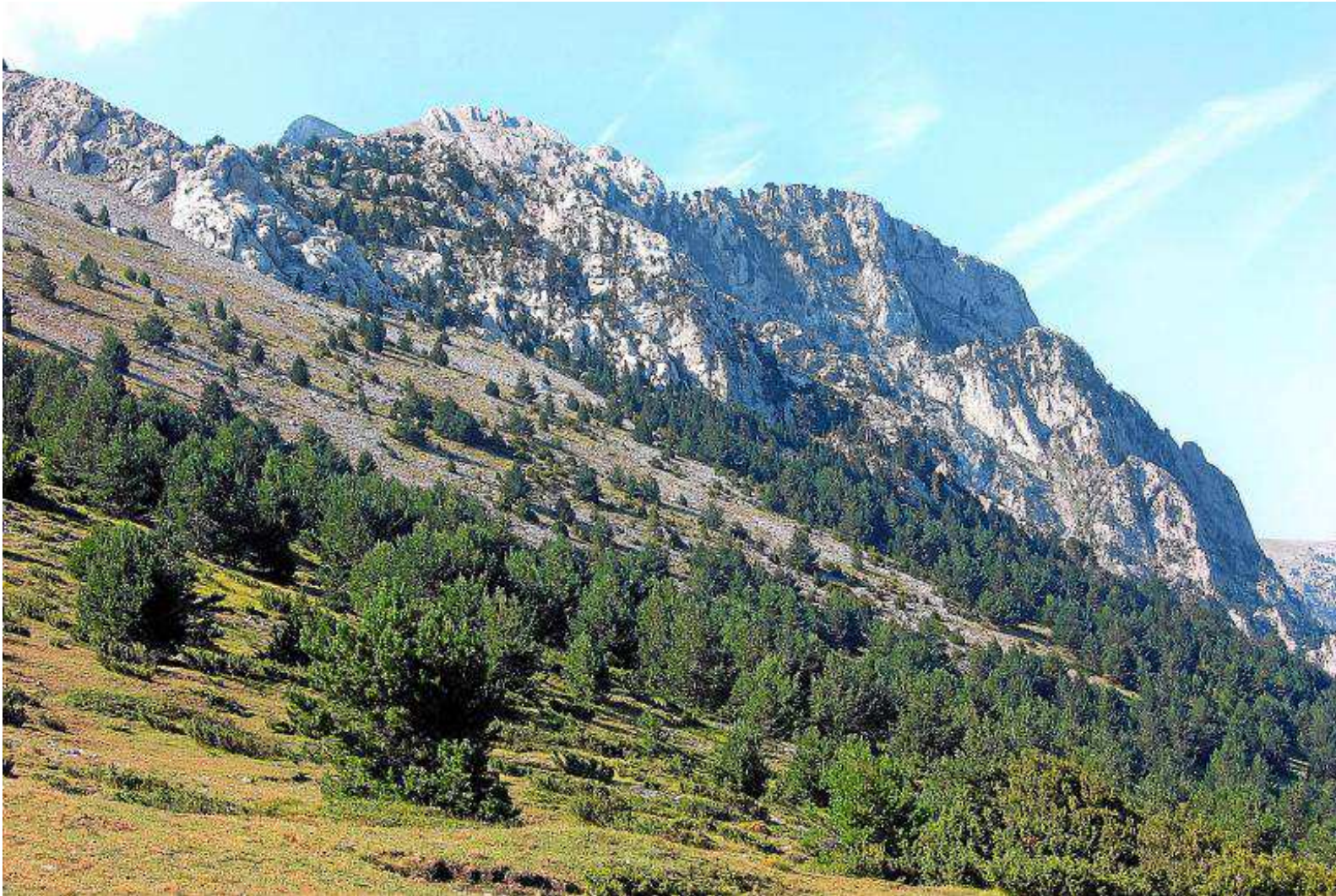
Vista del Turbón desde el puerto de la Muria. MIGUEL ÁNGEL ACÍN

E l Turbón, el señor de la Ribagorza, la cima más emblemática para sus gentes, esconde maravillosos paisajes que se pueden contemplar y disfrutar a lo largo de esta bonita salida montañera.