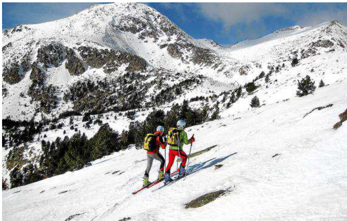
El esquí de travesía es una de las disciplinas en que más aludes se provocan. MONTAÑAS SEGURAS

Por otra parte, a la vista de las situaciones descritas, es preciso incidir en que los accidentados son personas con cierta costumbre en circunstancias semejantes; es más, en diversos medios han sido calificados como 'montañeros expertos'. De este modo, resulta ineludible insistir, hoy más que nunca, en que los problemas no solo suceden a los practicantes ocasionales, sino también a los que sobrevaloran sus capacidades