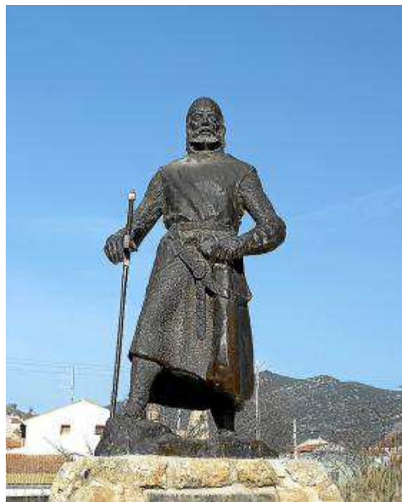
Escultura en El Poyo del Cid, de Luis Moreno.