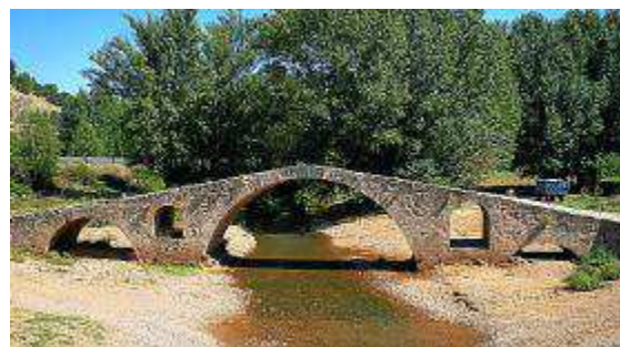
Puente romano en Luca de Jiloca.