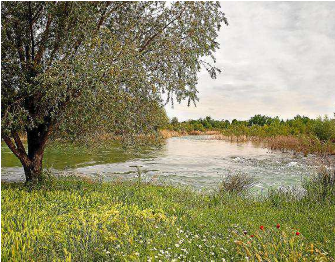
El río Cinca caracteriza el paisaje de Castejón del Puente.

El principio de esta ruta comienza en la plaza de la Cruz, en Castejón del Puente. Desde allí, salimos por la calle de la Balsa y apenas a 200 metros, en una curva a la derecha, tomaremos el antiguo camino de Monzón que desciende entre antiguos olivares, almendros y carrascas dispersas. En este primer tramo veremos especies vegetales como espino negro, retama, litonero, ephedra, carrasquilla o ruda. Entre las especies animales no será difícil ver paloma torcaz, zorro, mochuelo, abubilla, carbonero común, herrerillo común o el vuelo cernido del cernícalo vulgar.