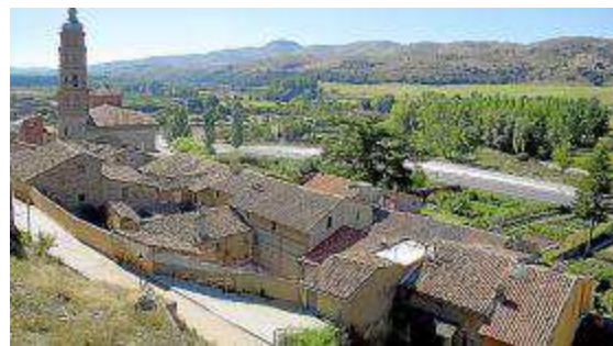
Vista panorámica de Burbáguena.