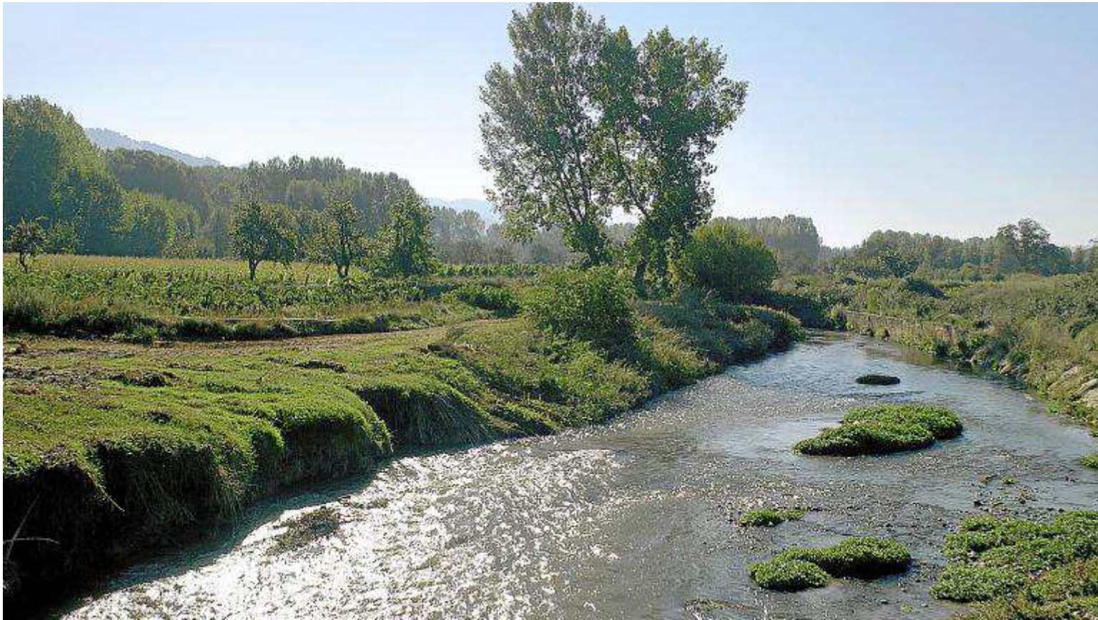
Río Jiloca a su paso por el término de Báguena.

El 'Cantar del Mio Cid' y su descripción de las tierras que recorrió Rodrigo Díaz de Vivar hasta tomar la ciudad de Valencia son el eje con el que se creó, en el año 2002, el Camino del Cid, un sendero de gran recorrido que permite descubrir el atractivo natural y monumental de los parajes y poblaciones que recorrió el caballero al frente de sus huestes, a principios del siglo XI.