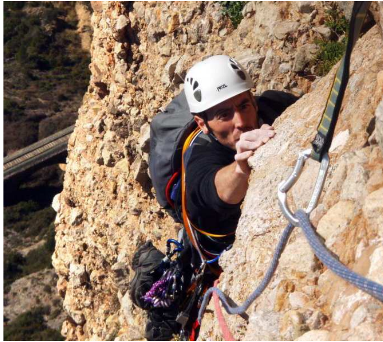
Buitrera del segundo y tercer vivac de Rabadá y Navarro. ÁLEX PUYO