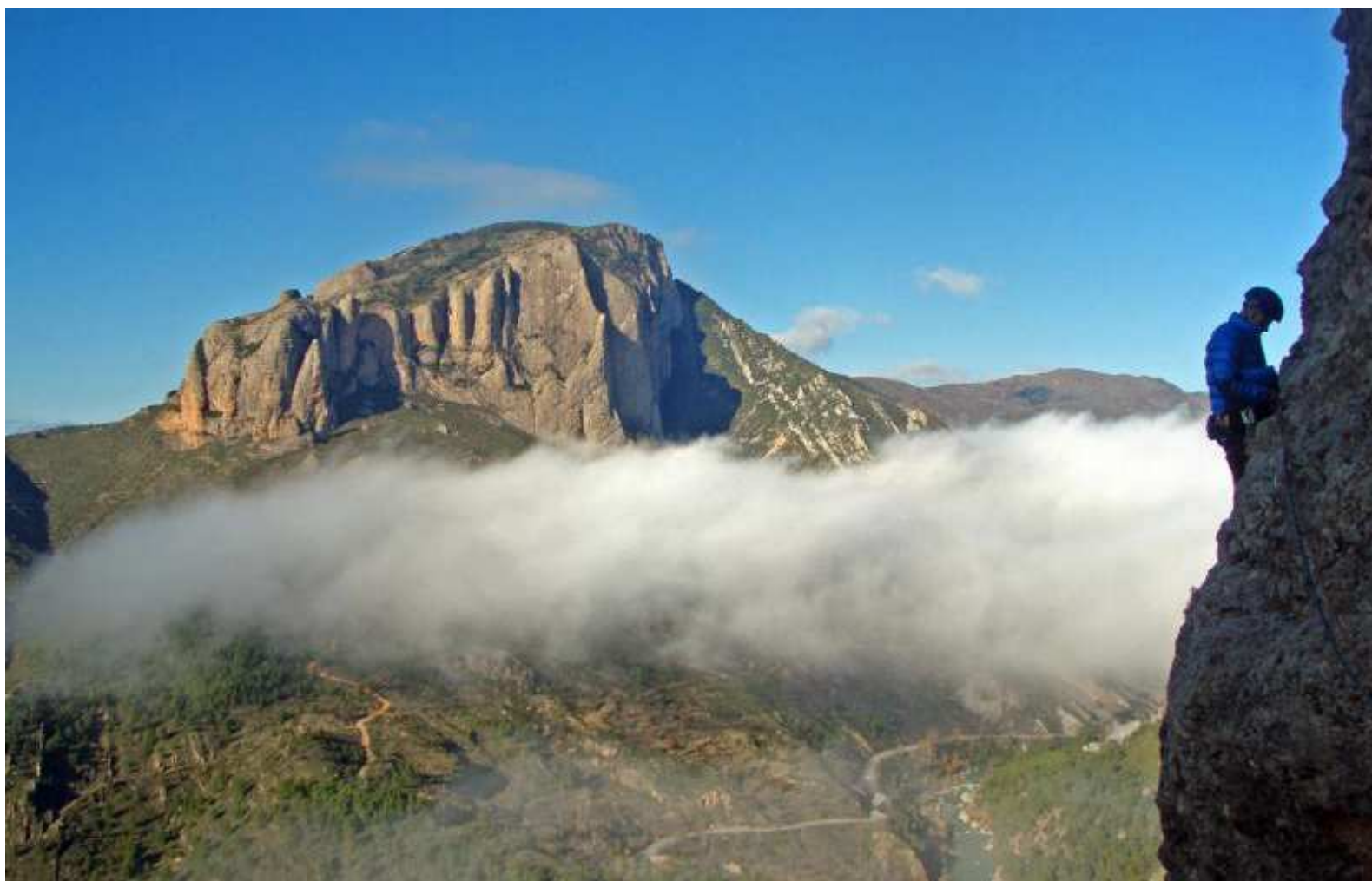
Travesía del segundo largo. Al fondo, Peña Rueba. ÁLEX PUYO

H ace exactamente 50 años, durante 'los Pilares' de 1961 y mientras Zaragoza se divertía en sus fiestas patronales, dos de sus vecinos estaban pasando a la historia de la escalada por realizar una de las vías más audaces y deseadas de la época: el espolón sur del Firé en los mallos de Riglos.