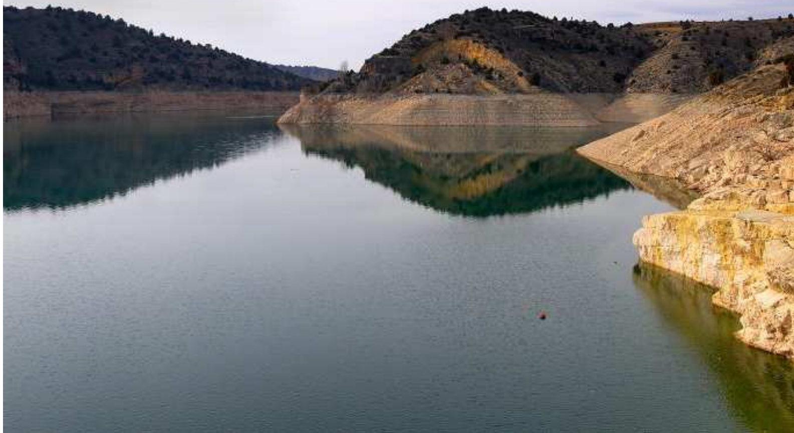
Embalse del Arquillo, paraje por el que transcurrirá una de las rutas propuestas.

Los aficionados a la montaña tienen una cita el próximo domingo 23 en la ciudad de Teruel, donde se celebrará la XIII edición del Día del Senderista en Aragón. Como es tradicional, esta cita ofrece la oportunidad de elegir entre varias caminatas guiadas de distinta longitud y exigencia para que todo el mundo escoja la más apropiada. Después, todos participarán en una comida. Una jornada de camaradería y de reivindicación del montañismo que este año, como aliente añadido, permitirá también disfrutar del rico patrimonio artístico de la capital turolense, punto de salida y llegada de las cuatro rutas programadas.