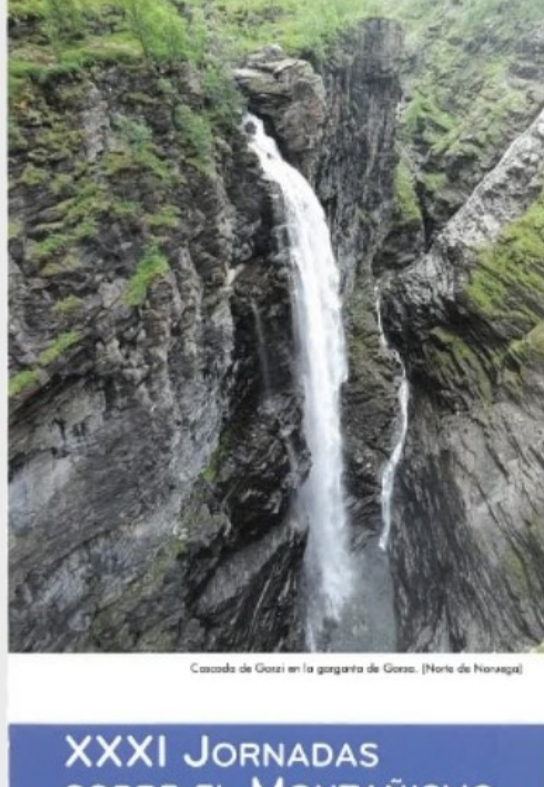
Cascada de Glazi en la garganta de Glazi. (Norte de Pinaraga)

Primer año de esta nueva competición deportiva en la que hemos puntuado 8 pruebas realizadas a lo largo de todo el territorio aragonés. Pruebas muy diferentes entre sí, habiendo ultras, kv verticales, carreras de 9 km, etc. y distribuidas durante todo el 2023. Podéis consultar las clasificaciones provisionales en el enlace. Leer más